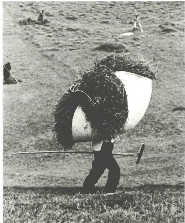
Il purtader «virtuos»: il ponn tegn da sez la pesentincla. In bratsch tonscha per tener il buordi, l'auter ei libers (Breil 1937).