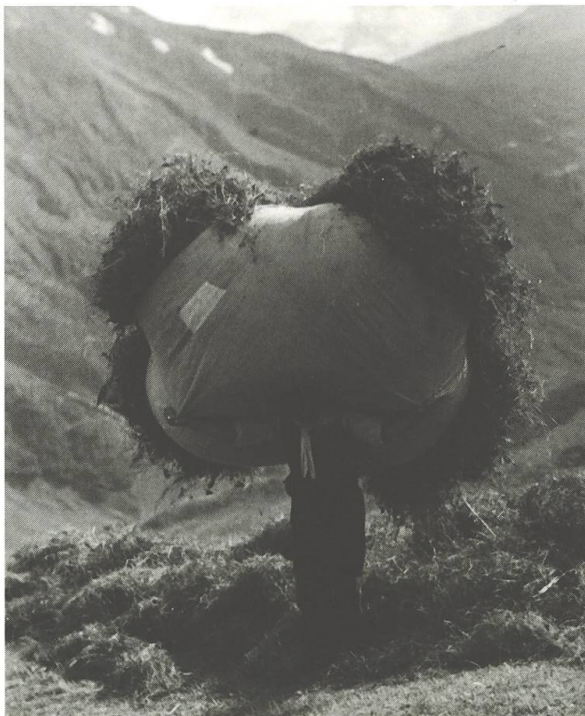
Il purtader «mudergiau»: cun omisdus mauns sto el tschappar per la teila dil blah per buca schar mitschar davosgiu.