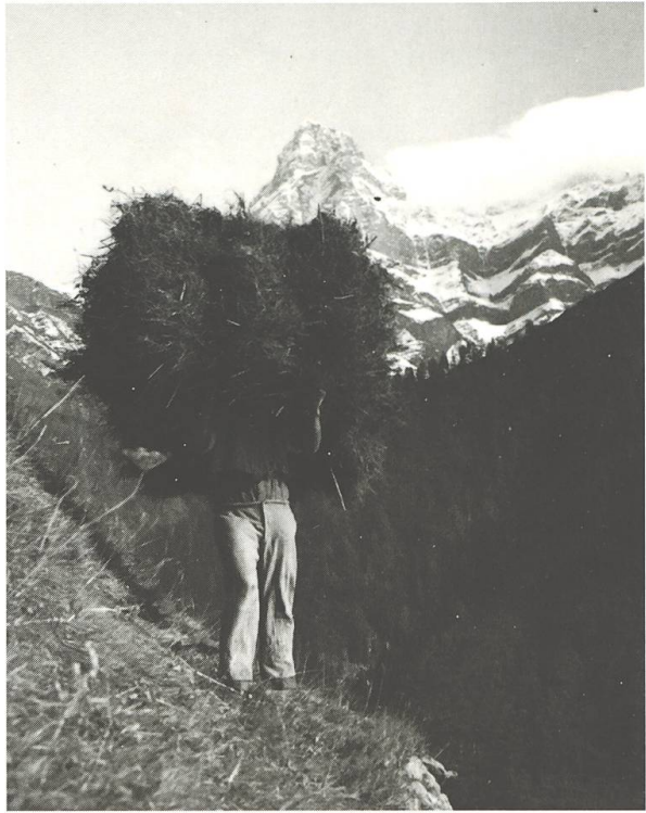
Valrein, entuorn 1940.