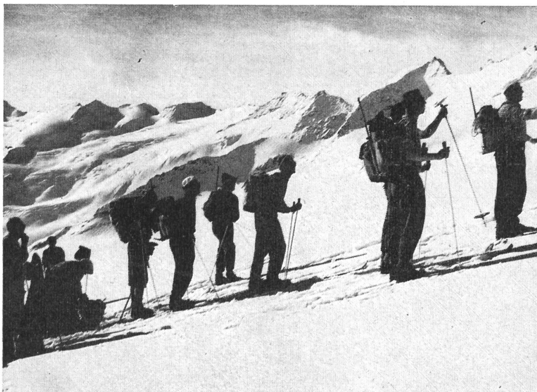
Im Aufstieg unterhalb der Wetterlimmi, vor der Kette des Ewigschneehorns.