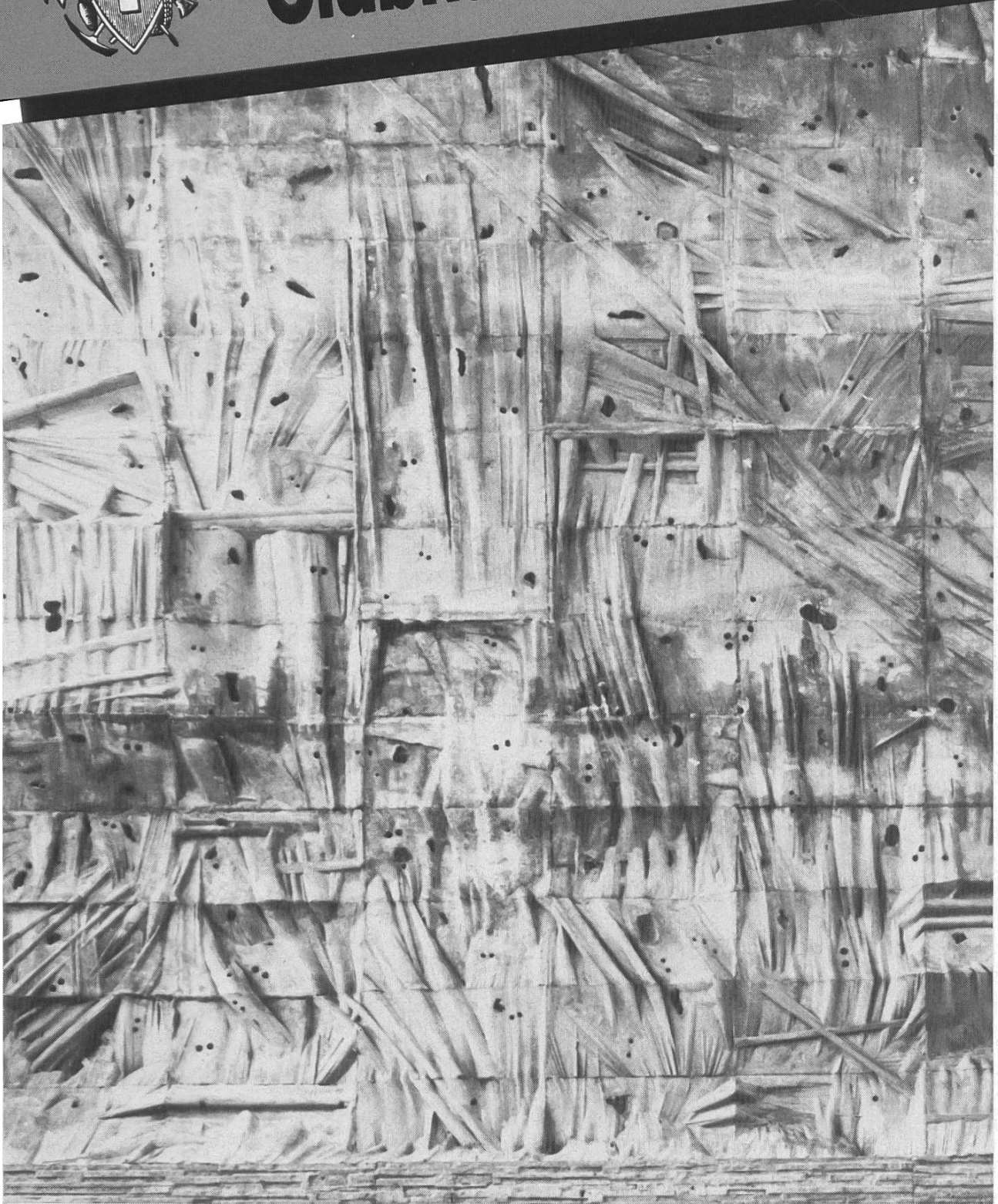
Begehbare Kunst: Kletterwand Neufeld