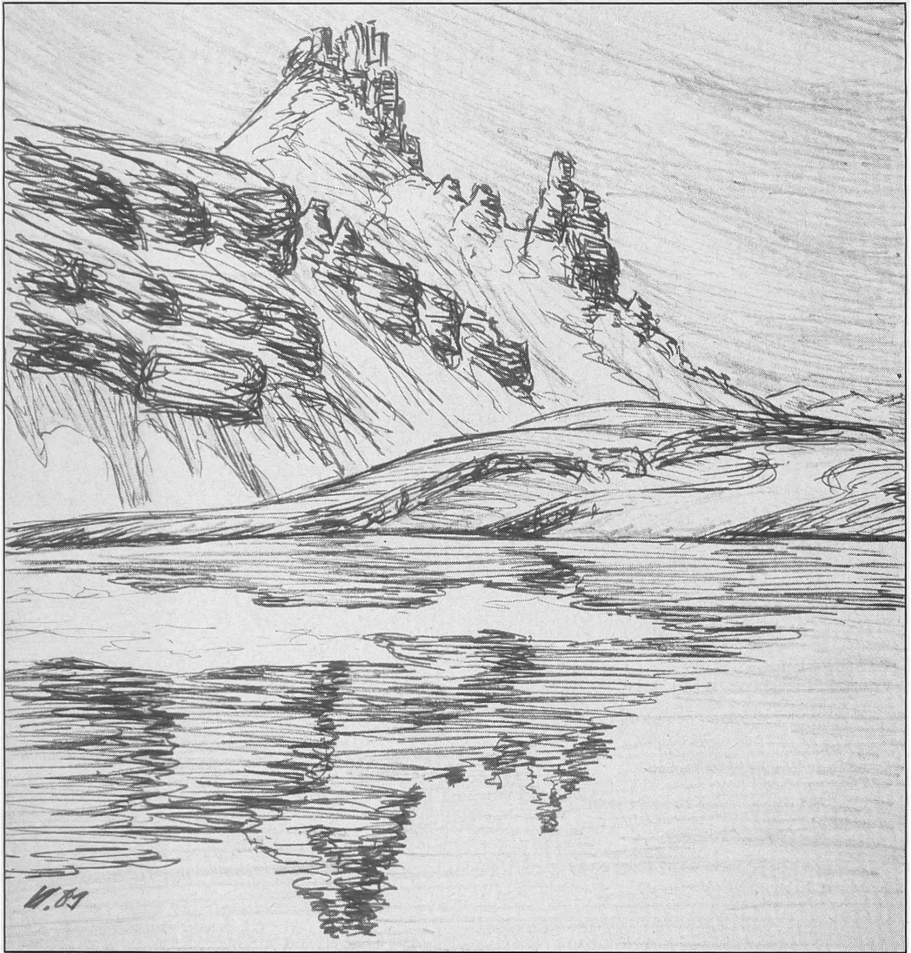
Schottensee im Pizol-Gebiet. Zeichnung: Paul Kleiner