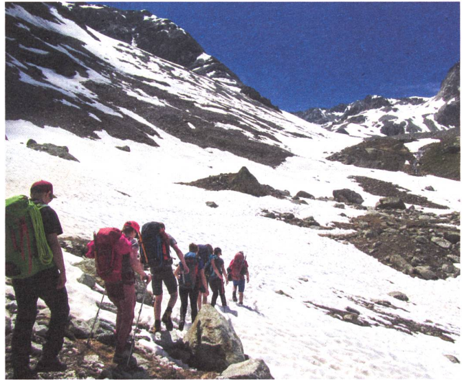
Unterwegs sind Schneefelder und ein reissender Bach zu überqueren.