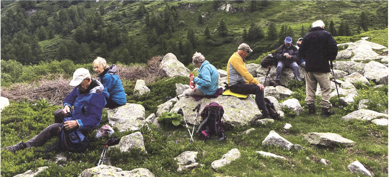
Die zahlreichen Teilnehmerinnen und Teilnehmer wählten ihre Tagesziele je nach Lust und Kondition.