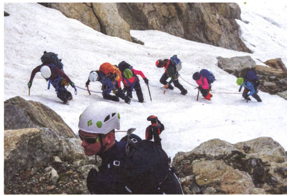
Felspassage auf dem Weg zur Südturmlücke.