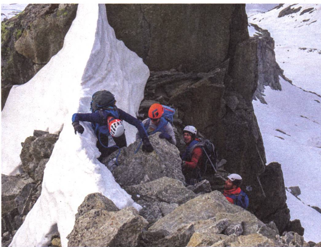
Klettern am kurzen Seil.