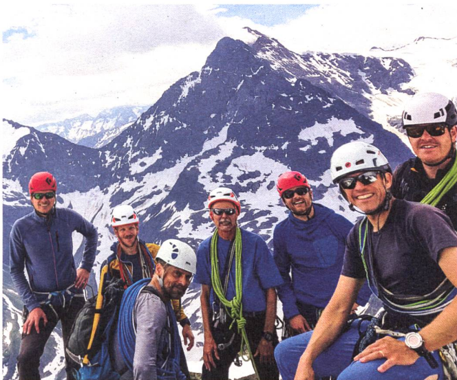
Die Hochtourengruppe auf dem Gipfel.