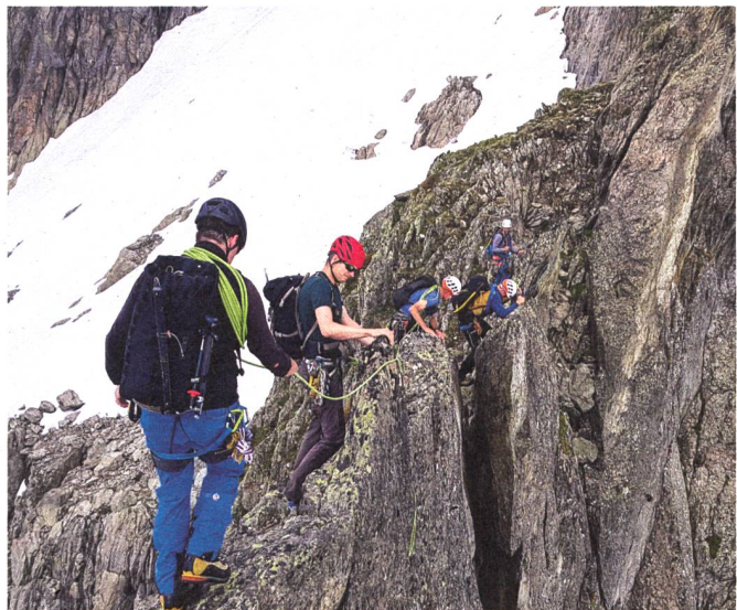
Anwendung der Zacksicherung.