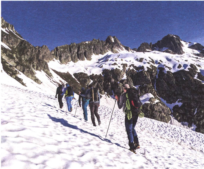
Unterwegs in Richtung Sustenlochspitz (rechts).