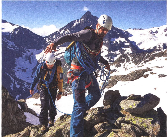
Flott unterwegs auf dem Grat.