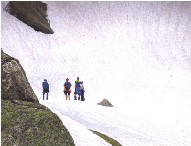
Tourenvorbereitung am Vortag: Routenplanung für morgen.