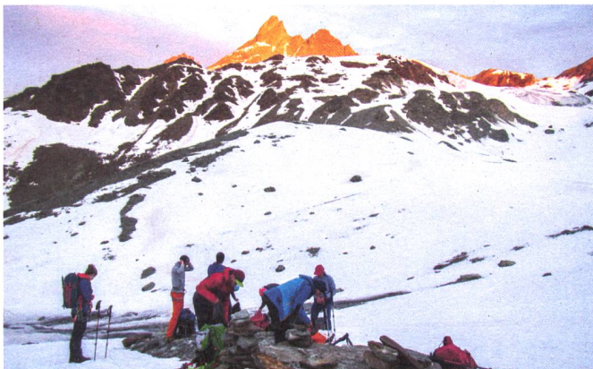
Vor dem Gletscher, Ort des Anseilens, ca. 3260 m. In der Morgensonne leuchten die Aiguilles Rouge d'Arolla 3517 m.