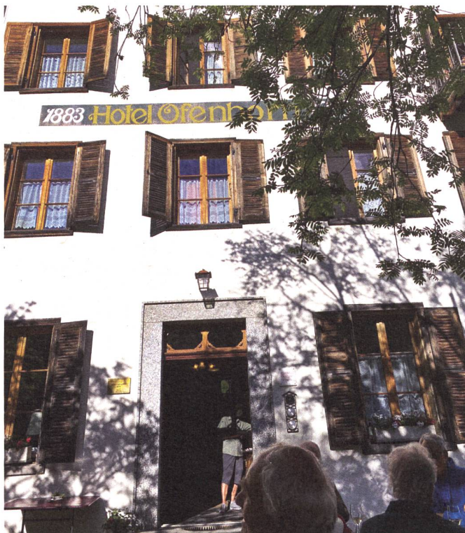
Im sanft renovierten Hotel Ofenhorn liessen wir uns vom sympathischen Team verwöhnen.