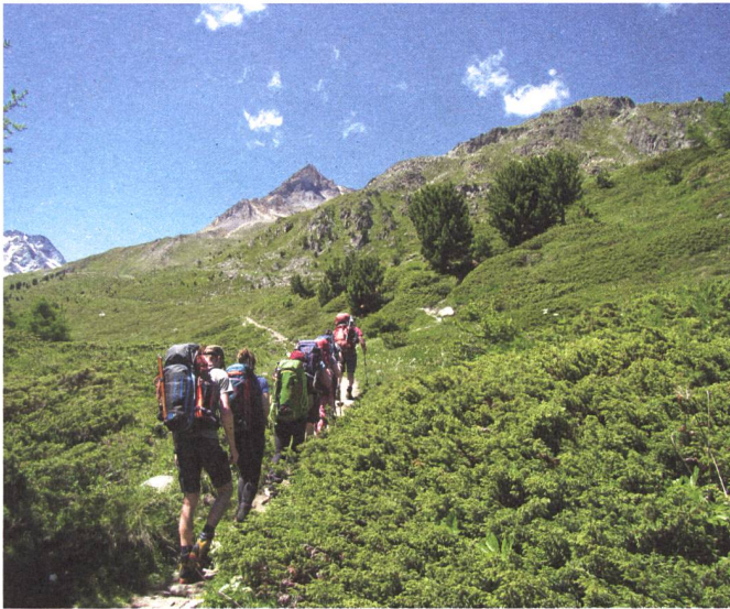
Start zum Höhenweg bei schönstem Wetter.