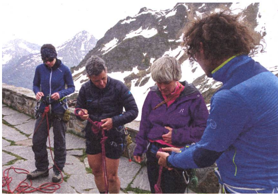
Knotenkunde für die Seilverkürzung.