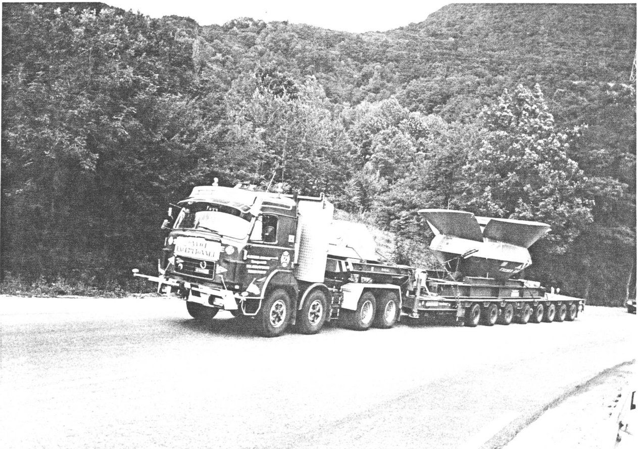
Einer der Transporte von Otto Zuber, unterwegs nach Barcelona.