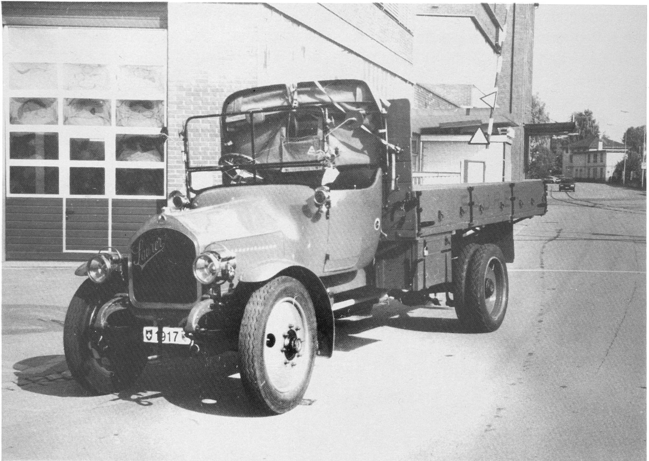
Saurer 3TC, Jahrgang 1917