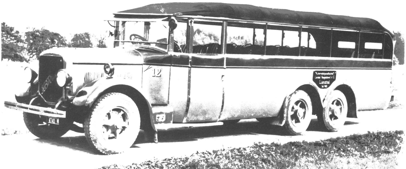
FBW/Seitz (N) 6R 4t Henschel 6/115x160 Omnibus (1929) der Automobilgesellschaft Liestal-Reigoldswil AG

Das ist ein Bild aus dem 1996er Kalender! Was aber zeigen die anderen 12 Fotos? Wo wurden sie aufgenommen?