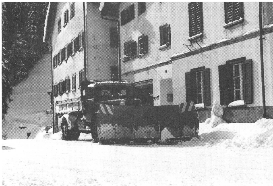
Saurer 5D 1963 : Beinahe 25 Jahre im haertesten Einsatz. Hauptsaechlich im Safiental.