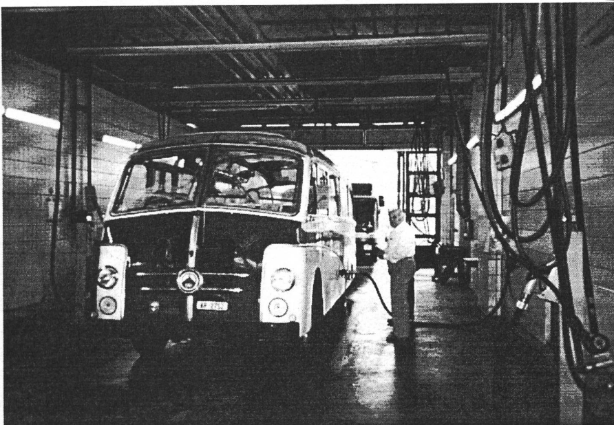
.Die Tankstelle für jeden der 30 Oldtimer. ,

Herisau Rheineck Gaissau Bregenz Lindau München. 07.15 Ankunft Bushof Ost (245 Km). Bei der Einfahrt in den Bushof mussten wir noch warten, wir waren etwas zu früh. Nachher gings zur Tankstelle