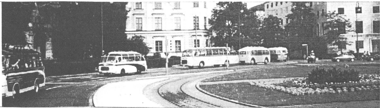
Korso am Karolinen-Platz Obelisk

Am Korso waren die 30 Oldtimer der Marken MAN, Benz, Mercedes, Neoplan Daimler-Benz, Setra, Ikarus, Doggenmüller - und ein SAURER aus der Schweiz. Welch ein Stolz für den Chauffeur !