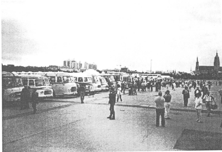
Theresienwiese im hintergrund der Zirkus

Die Zeit war im Fluge ver- strichen..... leider... ..