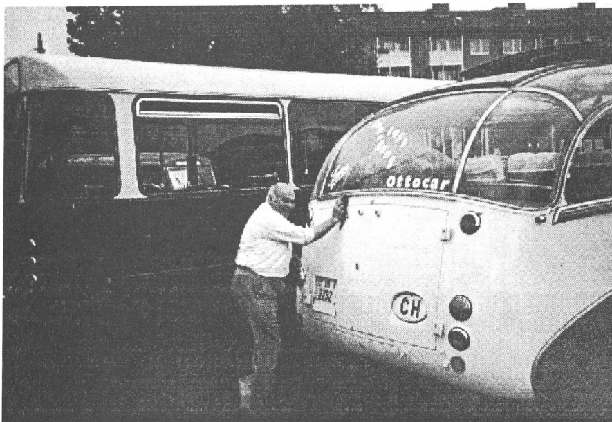
Gutgelaunt wird die Hand-Reinigung in kauf genommen.

Beifahrer Pesché Foto, Otto Besitzer des Saurer 1951 sagen nochmal Danke. Es waren 7'000 Besucher anwesend.