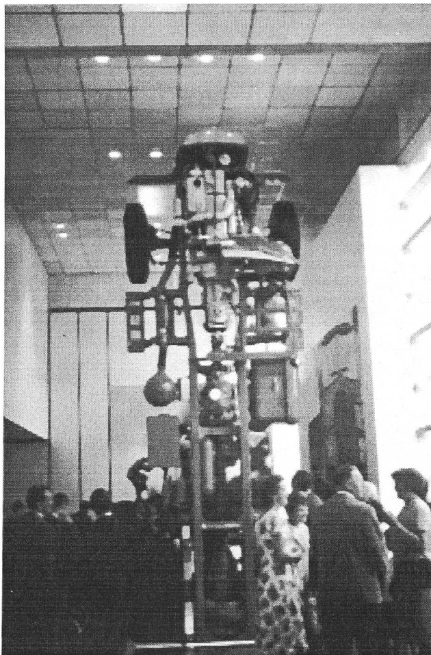
Saurer 5DM an der Landesausstellung 1964 in Lausanne

La qualité de notre production est notre meilleur atout pour son écoule- ment. Un produit de qualité, symbo- lisé par ce moteur Diesel, a exigé les meilleures forces d'une équipe de savants, de fabricants, d'ingénieurs, de techniciens, d'employés, de contre- maîtres et d'ouvriers. Plus que jamais, la paix dans le travail est la condition absolue de notre existence à nous tous.