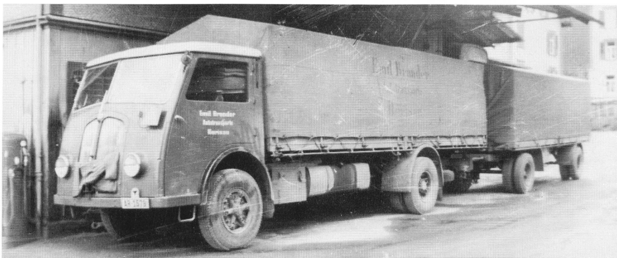
Auf dieser Aufnahme von 1950 ist das obere „Bett“ gut sichtbar

Von der Motorfahrzeug-Kontrolle war diese Frontlenkerkabine mit 4 Sitzplätzen zugelassen. Die beiden hinteren Sitze brauchte ich meistens nicht, weshalb darüber ein Brett eingepasst wurde, das vorne auf den Rücklehnen von Fahrer- und Mitfahrersitz und hinten auf Winkeleisen-Konsolen auflag. Mit einer Untermatratze gepolstert und mit Stoff überzogen wurde daraus ein schmales Bett, das aber auch nach oben nur sehr spärlich Raum bot. Darunter wurde die Lücke zwischen den Sitzpolstern der beiden hinteren Plätze mit Woldecken ausgefüllt, womit sich eine zweite schmale Liegefläche ergab, die man durch Kriechen hinter die Motorverschalung, und oben begrenzt durch das Brett, aufsuchen musste.