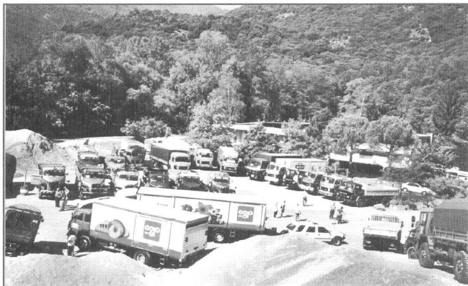
Was für ein Parkplatz!

Für mich war es die erste Fahrt an ein Saurer-Treffen, und auch die erste Fahrt überhaupt mit einem Saurer!! Doch kurz der Reihe nach: der Hafer hat mich natürlich schon lange gestochen, einmal werde auch ich an einem Saurer-Treffen teilnehmen, das wünschte ich mir schon an der letzten Hauptversammlung. Und nun ging dieser Wunsch schon in Erfüllung! Eine kurze, aber zackige Fahrschule bei „maître“ Thomas Kugler, und ich konnte mit dem D290 F8x4 umgehen. Für die Wenigen unter Ihnen, die es jetzt noch nicht begriffen haben: der OCS-D290 ist der Tankwagen. Sein Konterfei finden Sie übrigens auf unserer Homepage! Am Freitag-Abend „sattelten“ meine Frau und ich den Wagen und starteten in Richtung Süd. Wir fuhren noch bis Splügen, wo wir mit dem grossen Auto stolz direkt vors Hotel fuhren. Am Samstag-Morgen Tagwache unter einem strahlendblauen Spätsommerhimmel, und eine herr-