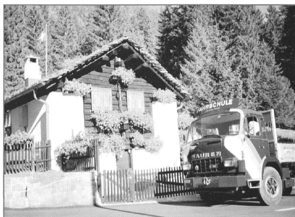
Malerisch und ohne Verkehr präsentierte sich die alte Pass-Strasse zwischen Mesocco und San Bernardino.