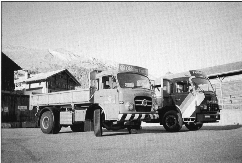
Die Fahrzeuge des OCS und des Autors, friedlich vereint!

Am Samstag präsentierten sich bei schönstem Wetter gegen 80 Lastwagen in bester Kulisse. Von den alten Haubenwagen aus den 50ern, über die im Tessin weitverbreiteten Allrad-