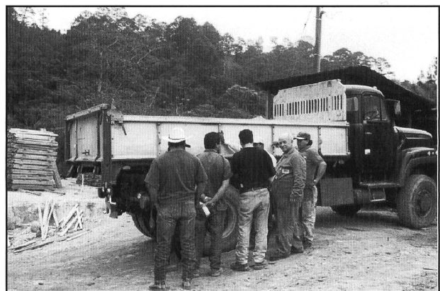
Kurs Saurer 230N 4x4

Es sind schon Strapazen. Vor allem volle Konzentration ist erforderlich.