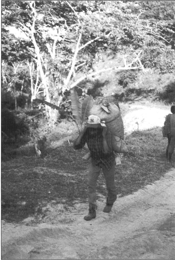
Kaffeetransport 60 kg

Das Beneficio reinigt die Rohkaffeefrucht bis zum Kaffee Oro. Aller Strom wird in der Finca Cisne mit Generatoren, 2 Detroit Motoren zu je 500 PS, produziert.