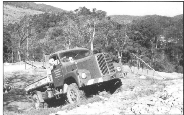
Probefahrt Kaffee Finca Honduras

Die Fahrzeuge werden jetzt auch eingesetzt für den eigenen Strassenbau. Blasto = Kies/Schotter wird aus den Flüssen geholt.