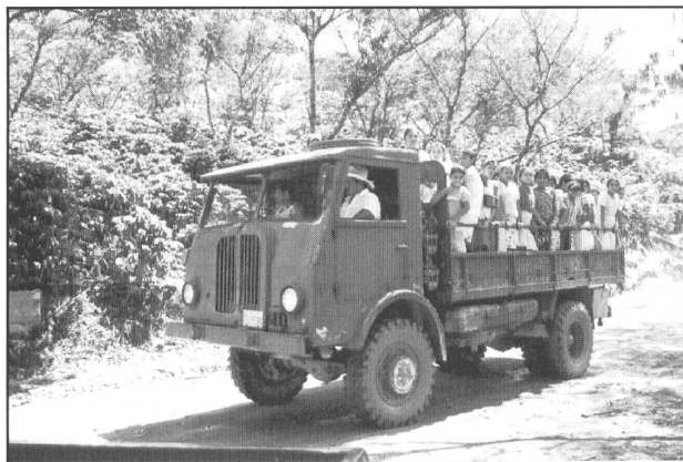
Einsatz UCM Kaffeepflanzung Guatemala

überholt, jedoch ohne anzuhalten. Meistens wollen die Holz oder Geld.