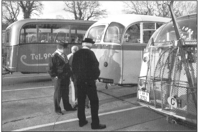
Vor Beginn Oldtimer-Parade wurden die Fahrzeuge mit Kennermiene begutachtet und gute Ratschläge erteilt

einer Polizei-Eskorte - für sich allein beanspruchen zu können, bleibt sicher allen Teilnehmern als einmaliges Ereignis noch lange in Erinnerung. Besonders die Schweizer Teilnehmer dürften festgestellt haben, dass ihre Liebe zu den Fahrzeugen mit den Namen Berna, FBW und Saurer auf ein grosses Echo gestossen ist und sich die Bemühungen, ein Nationalgut zu erhalten, gelohnt haben.