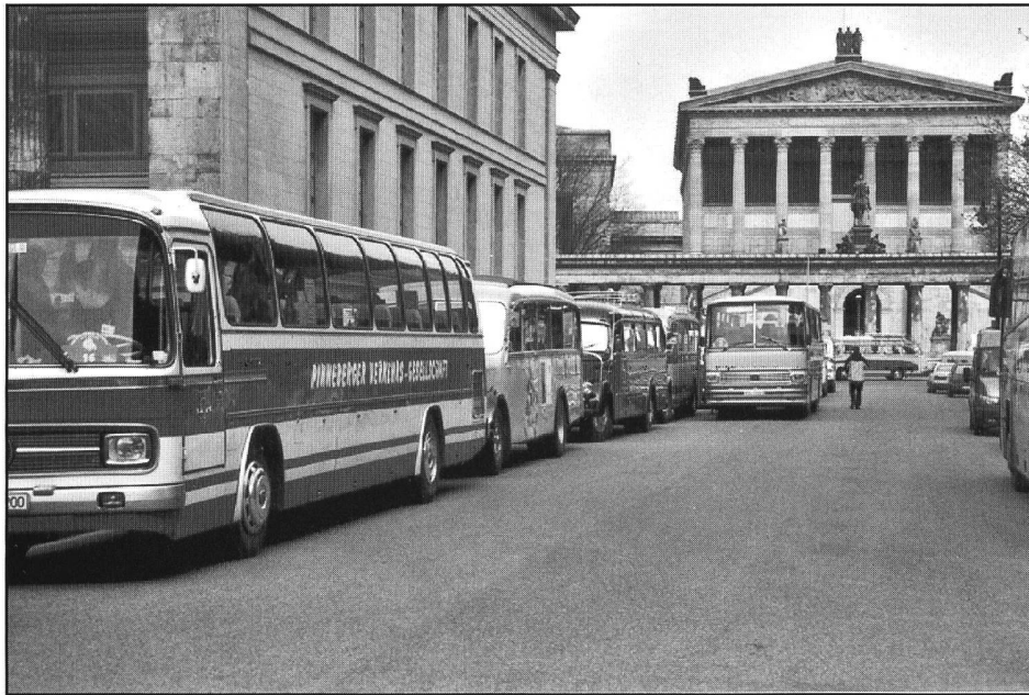
Ebenfalls zum Start bereit von vorn nach hinten: Reisewagen Mercedes-Benz, Typ 0302, Saurer-Bus Typ L4C, Reisewagen Mercedes-Benz, Typ 0-3500 und ein Setra-Reisewagen S130-H.