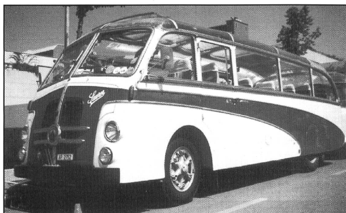
Die gehobene Reisewagenklasse aus früheren Jahren.