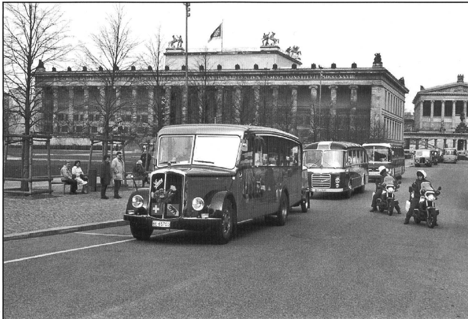
Der Bus-Konvoi ist gestartet zur Demonstrationsfahrt durch Berlin. Im Vordergrund Dyslis Oldtimer-Car, gefolgt von einem Neoplan-Car, Typ SH 7/8. Die Polizei kontrolliert die Wegfahrt auf Motorrädern.