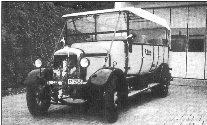
Das älteste an der Sternfahrt teilnehmende Fahrzeug war der FBW-Allwetterwagen, Typ F, mit Baujahr 1925, von der Firma Röllin AG.