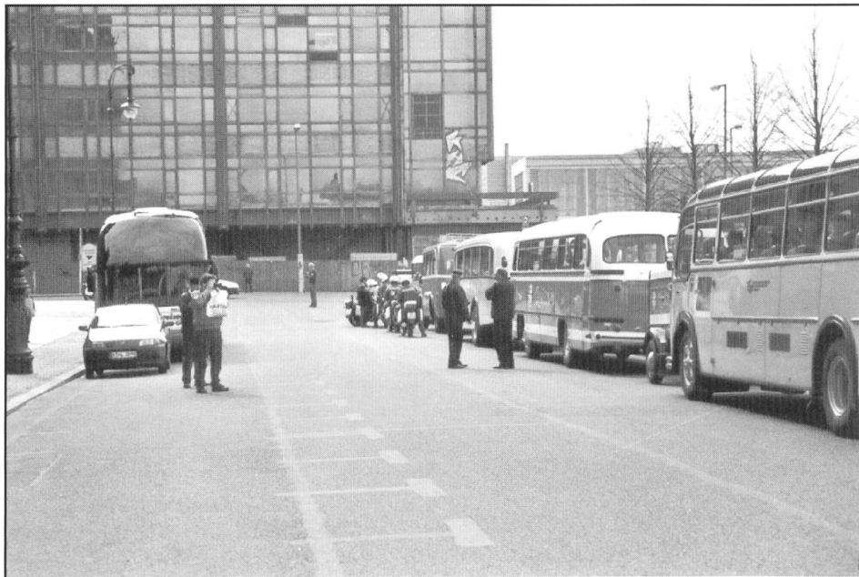
Die Spitze des Bus-Konvois vor der Abfahrt beim Berliner Dom. Im Vordergrund rechts ein FBW-Alpenwagen, Typ C40-U, 1959; vor diesem ein Reisewagen Mercedes-Benz, Typ 321 H, 1956.