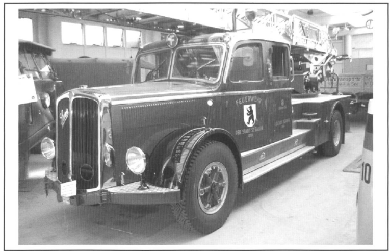
Unsere Drehleiter Tigerberg

sie am Sonntag in der Früh wieder ins Städtli, wo der Tigerberg seine Kollegen von der Berufsfeuerwehr St. Gallen traf. Von der „Helen“, der ältesten Vertreterin, über den 2DM-Löschzug bis zu den modernsten Fahrzeugen aus allen Korps des Kantons war alles zu sehen. Interessant, gut organisiert, Kompliment dem OK!