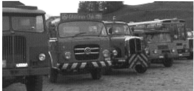
Eine herrliche Oldtimerparade! (Mittagspause in Disentis)

eigentlich berichten? Am besten ist wie meist: lasst Bilder sprechen!