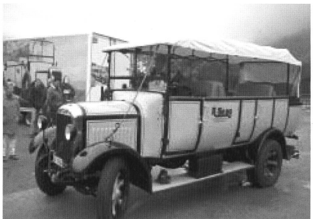
Unbestrittener Star der Ausfahrt: Röllins mit ihrem FBW-Gesellschaftswagen – standesgemäss im eigenen Trailer angereist!