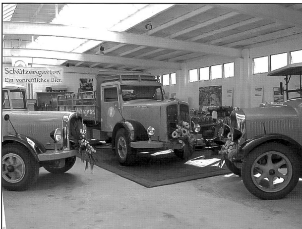
Die drei Saurer, der BLD links, der „jüngste“ C-Wagen in der Mitte und rechts die über 70jährige „Grossmutter“, der 2AD von 1929.

Ära, der älteste, ein Kettenwagen aus dem Jahr 1912, welcher für Schauzwecke, Corsos und Ausstellungen gebraucht wird, und ein D-Typ von 1982, der als Kipper umgebaut, weiterhin im Alltagseinsatz Malz transportiert.