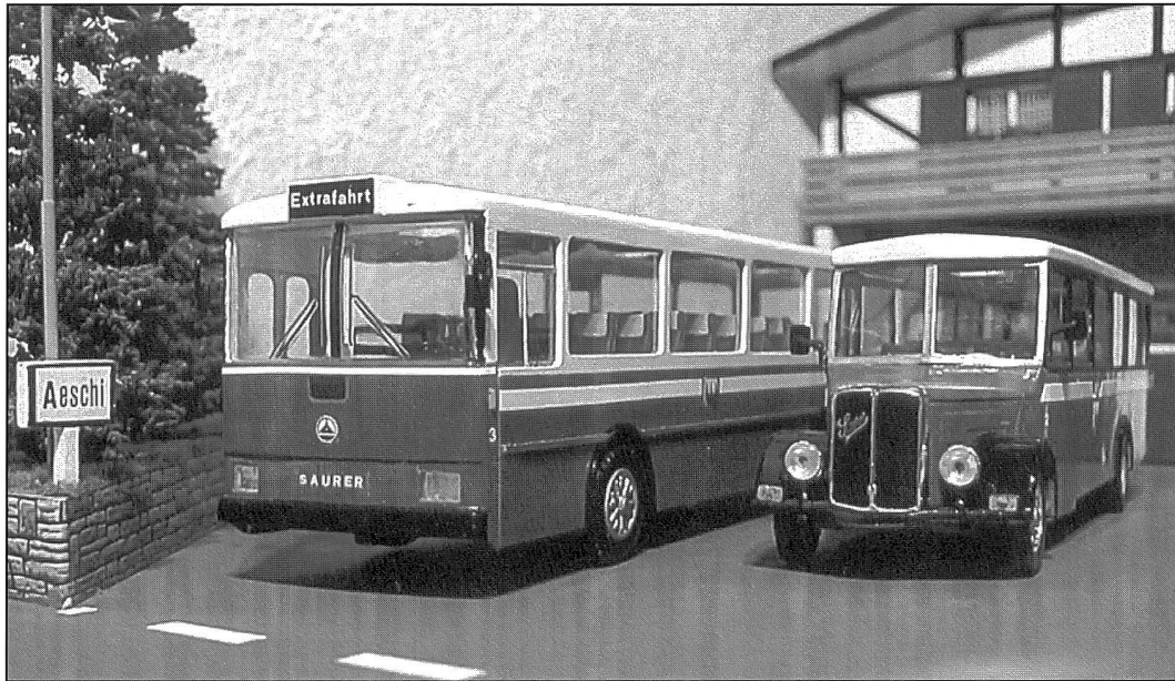
Die beiden Saurer-Omnibusse Typ RH 525-23 und L4C warten gemeinsam vor ihrer Garage auf den nächsten Einsatz.

Der aufmerksame Leser wird festgestellt haben, dass die abgebildeten Fahrzeuge meist mit „Autoverkehr AG Spiez (AVS)“ angeschrieben sind. Dieses Unternehmen gibt es in Wirklichkeit nicht, sondern stellt lediglich ein Fantasie-Gebilde von mir dar. Dadurch erhielt ich aber die Möglichkeit, die Anzahl Fahrzeuge und die verschiedenen Typen frei zu wählen und auf der Modellanlage zu integrieren.