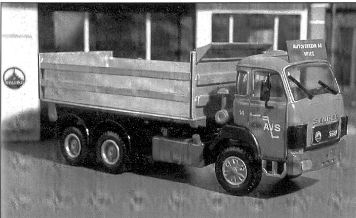
Saurer-Kipper, Typ D330 F, 6x4