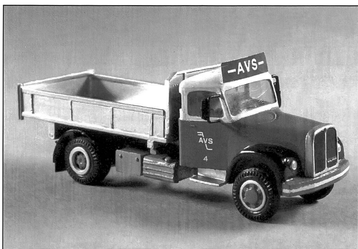
3-Seiten-Kipper, Saurer Typ 5DM 1966, Eigenbau 1968