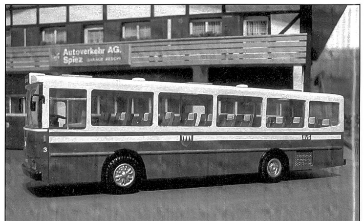
Saurer RH 525-23 Omnibus, Baujahr 1982/83, Eigenbau 2001