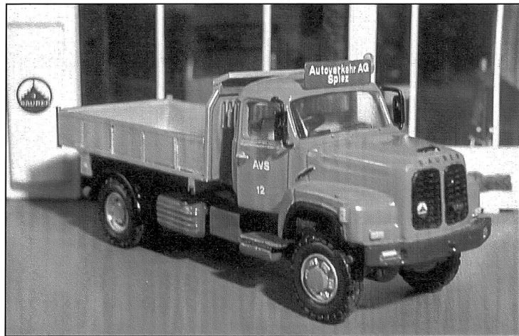
Saurer-Kipper, Typ D290 N, 4x4

Die Kabine dieses Wagens konnte ich erwerben und anschliessend auf dem selbst gebauten Chassis inkl. Ladebrücke montieren.