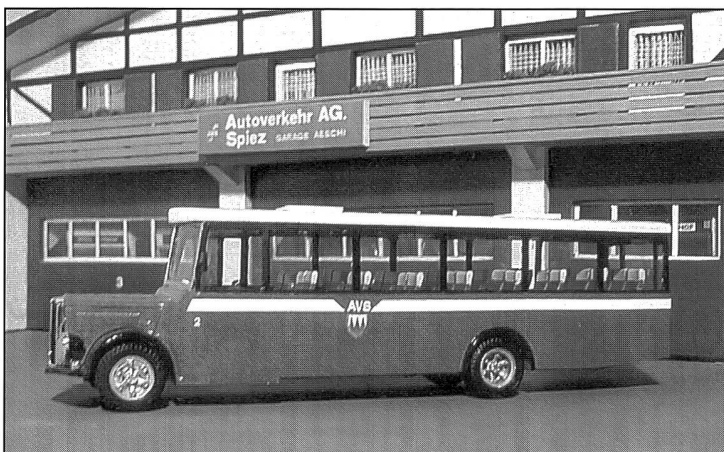
Saurer L4C Omnibus, Baujahr 1970, Eigenbau 1999