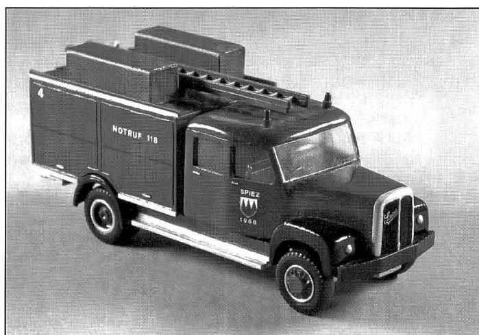
Tanklöschfahrzeug Saurer Typ 5DM 1966, Eigenbau: 1969