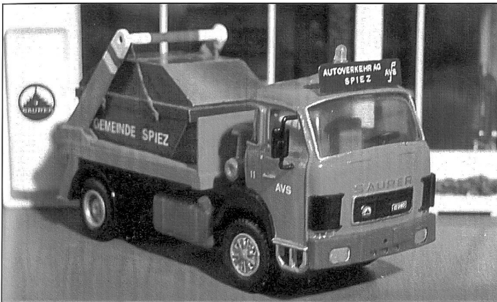
Saurer-Welaki, Typ D290 F

Um jedoch den von mir bestimmten Fahrzeugtyp anzufertigen, musste ich für jeden dieser Wagen ein neues Chassis nach Saurer-Muster anfertigen inkl. Aggregate wie Achsen, Getriebe und Bremsluftbehälter. Das Chassis mit montierter Kabine erhielt letztlich einen selbst gebauten Aufbau.