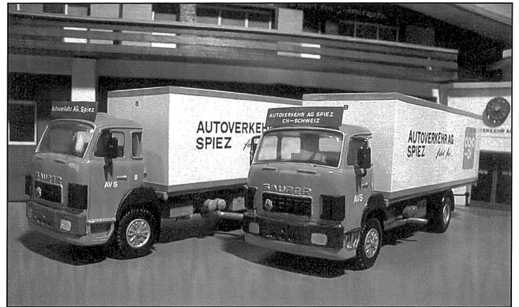
Saurer Typ D330 F mit Isothermaufbau