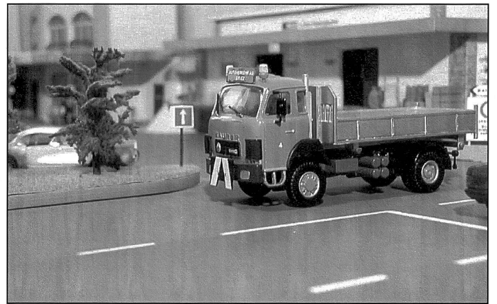
Allrad-Kipper, Saurer Typ D330 BF, 4x4