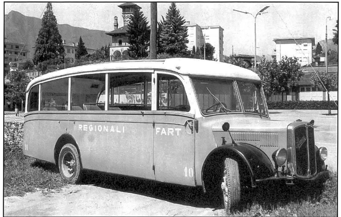
Saurer/Regazzoni 2C CR1D Alpenwagen (1946) der FART

Die 13 ganzseitigen Schwarzweissfotos machen den Busoldtimerkalender 2004 (Format 42 x 30 cm) zum idealen Geschenk für verkehrshistorisch Interessierte.