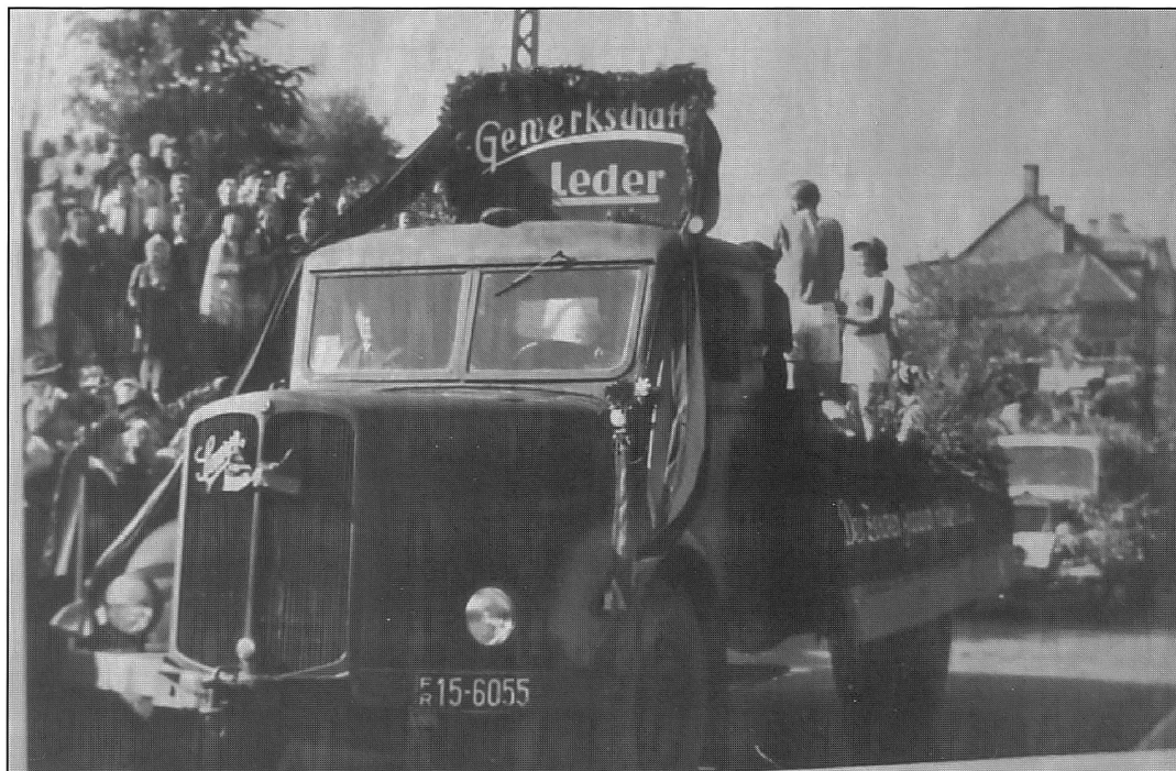
Foto aus den 50er Jahren: Saurer, vermutlich aus österreichischer Produktion. Kennzeichen: FR steht für Französisch Rheinland (Besatzungszone), die Zahl 15 für die Stadt Primasens (D).