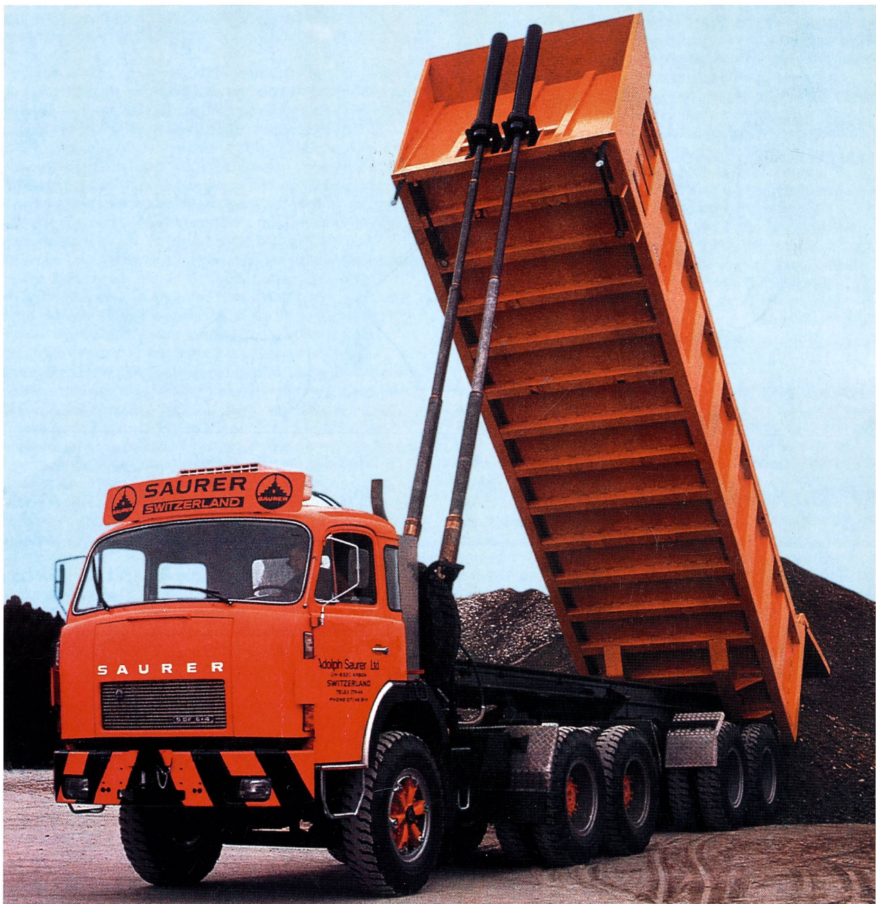
Export-Sattelschlepper SAURER 5DF 6x4, ausgestattet für den Einsatz unter harten Wüstenbedingungen im Mittleren und Nahen Osten. Das Gesamtgewicht der Zugmaschine mit dem 24m 3 -Kippmulden-Auflieger beträgt 60 t. (Über die Exportoffensive in den Nahen Osten wird in dieser Gazette berichtet)