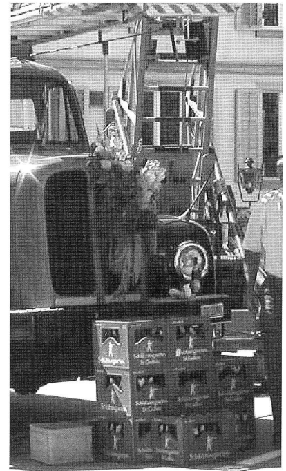
Die Equipe nimmt Abschied...