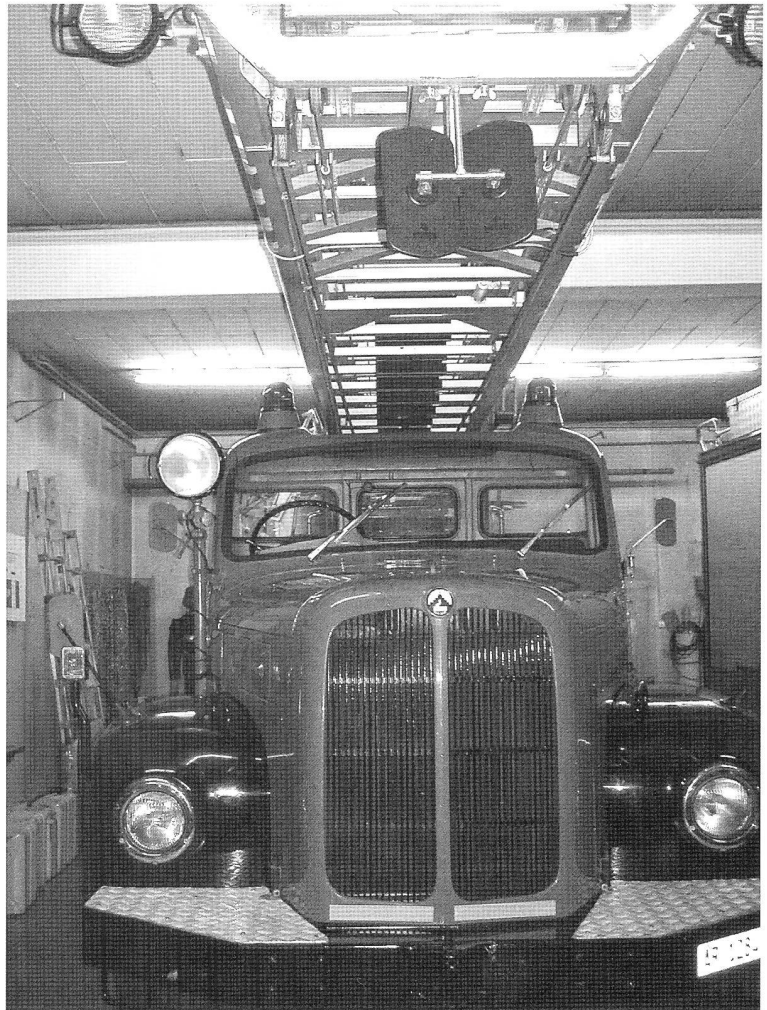
ADL Herisau noch im Aktivdienst* (Depot Fw Herisau, 18.11.2003)