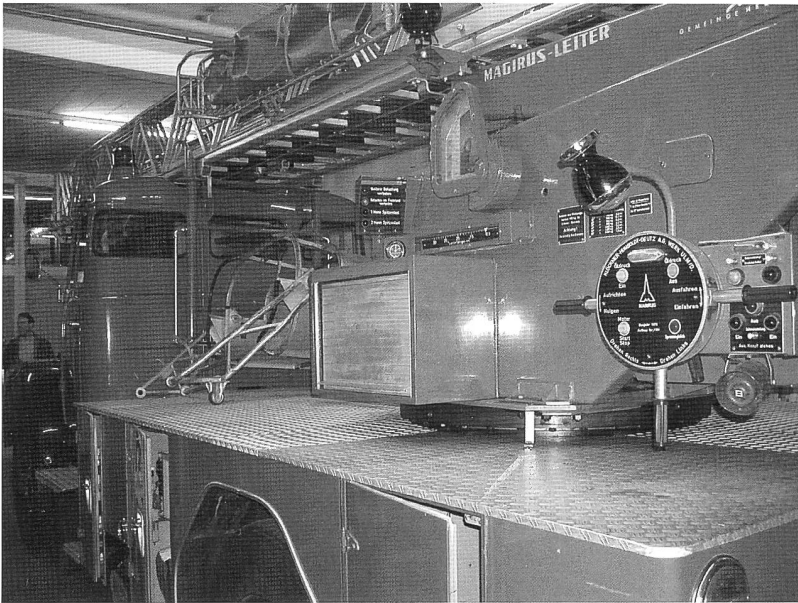
Detail der Magirus-Drehleiter. Das zentrale Bedienelement, die runde Scheibe mit den Hebeln für Heben und Senken, Drehen und Aus- Einziehen sieht eigentlich genau gleich aus wie bei der „Grossmueter“ Tigerberg 51 (Depot Fw Herisau, 18.11.2003)