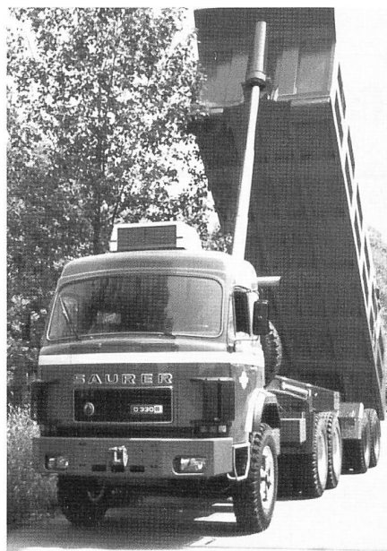
Saurer im Einsatz auf einer Baustelle im Irak