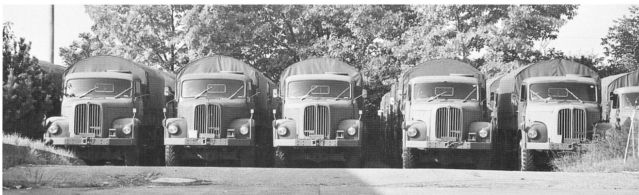
Verabschiedung 2DM - Bronschhofen

Nicht von jedem Ereignis können wir in Ausführlichkeit berichten. Sei es, weil sich niemand fand, der Bilder und/oder Texte lieferte, sei es, weil auch in der erweiterten Weihnachtsausgabe der Platz irgendwann knapp wird. Die Länge der Berichterstattung hat nichts mit der Qualität des Anlasses zu tun. Das möchten wir hier ausdrücklich festhalten. Jeder, der schon einmal einen Anlass organisierte, weiss wie viel Arbeit auch hinter einem „Regionaltreffen“ steckt, wie viele Abende geplant werden muss, wie viele Bewilligungen einzuholen sind, wie manchmal man am eigenen Optimismus fast verzweifelt. Allen Organisatoren, welche uns Gelegenheit bieten, unsere Schätze zu zeigen, allen, welche zum Erhalt der einzigartigen Schweizer Technikgeschichte beitragen, sei hier einmal wieder herzlich gedankt. In Kürze und stichwortartig mit ein paar Bildern dekoriert ist zu berichten über: