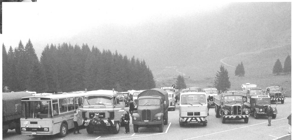
Auf der Schwägälp; es hätt „inehänggt“