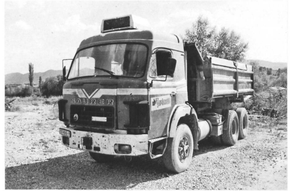
D330BF 6x4 ex Sattelzug von Radovis (Mazedonien)