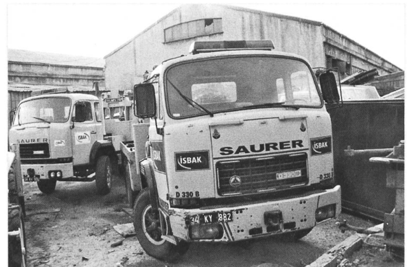
D330BF 6x4 der Firma ISBAC in der Türkei