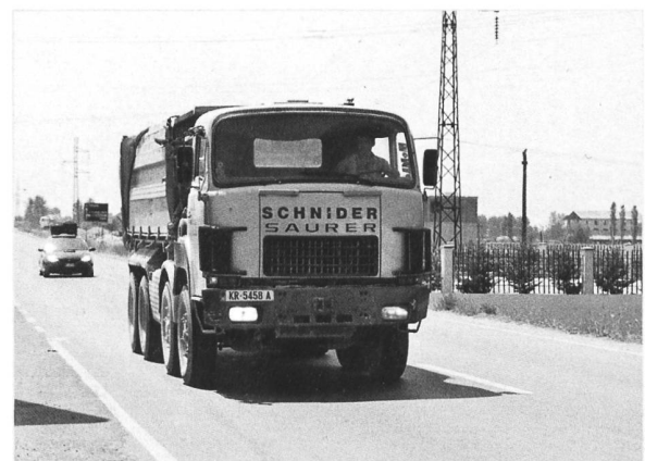
D330BF 8x4 von Schnider, Gonten (Albanien)