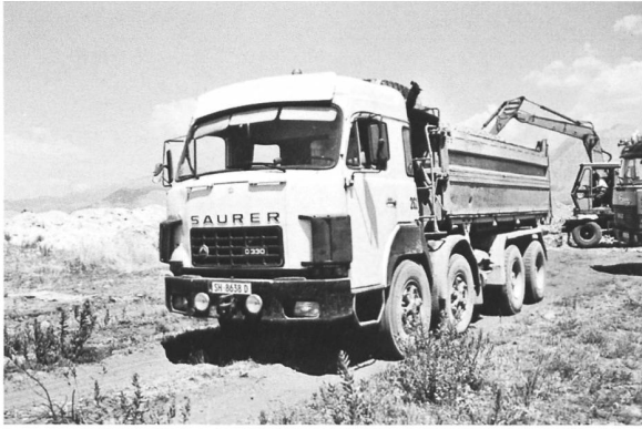
D330F 8x4 am Arbeiten (Albanien)