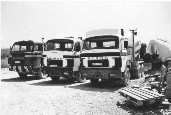
D330BF 6x4 wie in den 80er Jahren (Kosovo)