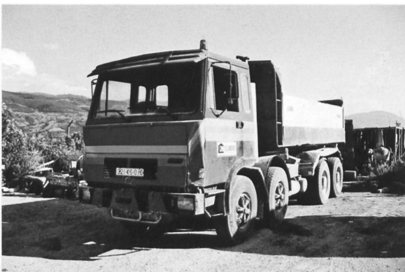
ex Nüssli FBW (Kosovo)