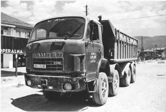
D330 F 8x4 in Mazedonien