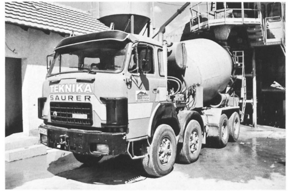
D330BF 8x4 bei einem Betonwerk (Mazedonien) ex Carlo Calzavara AG Bauunternehmung St. Gallen