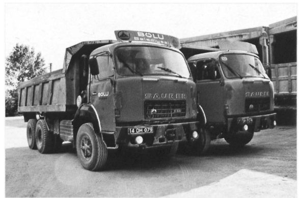
D330F 6x4 Gemeinde Bolu (Türkei)