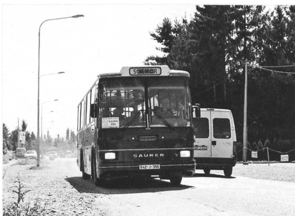
Saurer R+J RH 580-25 unterwegs in Banja Luka (Bosnien-Herzegowina)