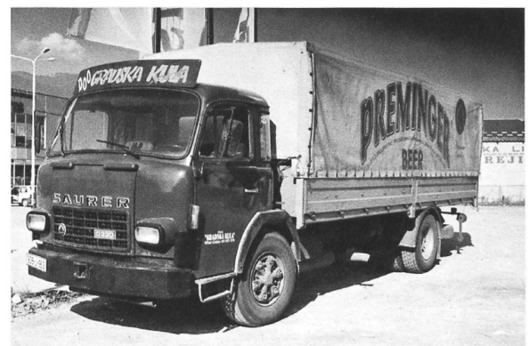
D230F 4x2 für Getränke-Firma unterwegs in Bosnien - Herzegowina