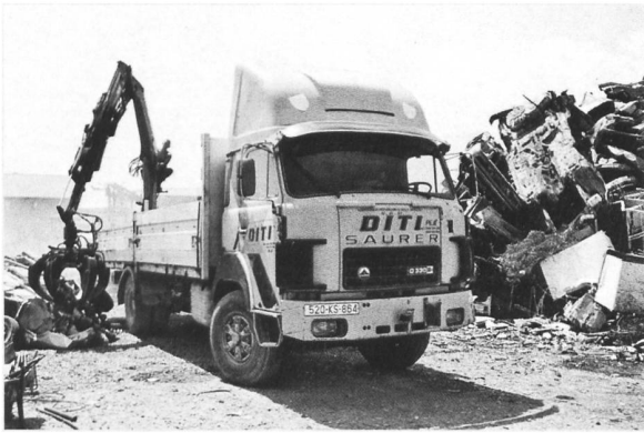
ex Ruckli aus Eschenbach LU im Kosovo