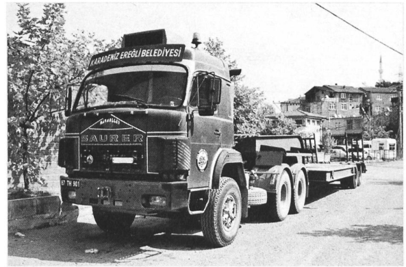
D330BF 6x4 Gemeinde Ereğli (Türkei)