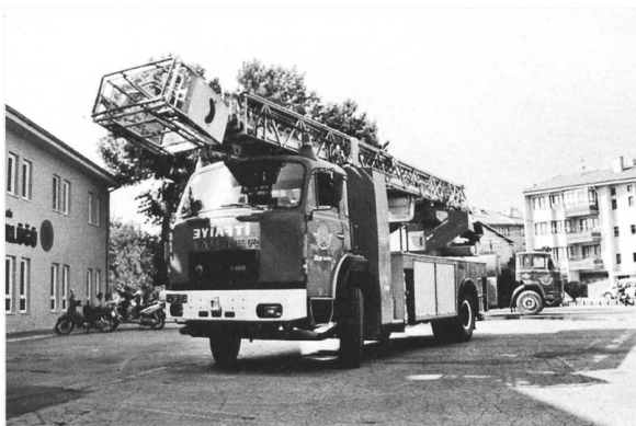
D250F 4x2 Feuerwehr, Gemeinde Bolu (Türkei)