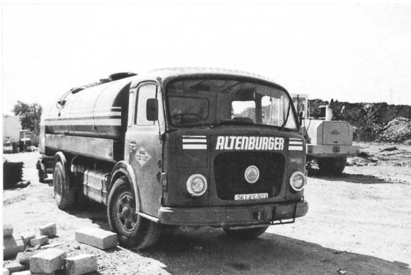
SDF 4x2 Altenburger Rapperswil SG (Kosovo)