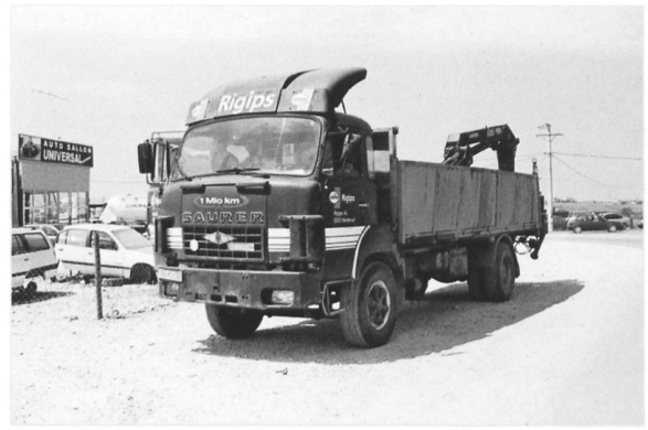
D290BF 4x2 ex Rigips (Kosovo)