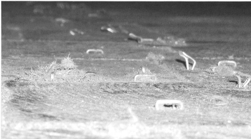
Hunderttausende dieser Agraffen waren im Klötzliboden und mussten einzeln herausgezogen werden

Rückbau fertig! Gezählt bis Mitte November haben 58 Helfer insgesamt 673 Frondienststunden geleistet und so den Rückbau praktisch gratis geleistet. Nebst vielen tüchtigen OCS-Helfern, den Saurer-Stiften und Gästen sind vor allem die Mitglieder des Rotary Clubs Oberer Bodensee zu erwähnen, die ihren Gemeindienst 2009 unserem Museumsprojekt gewidmet haben. Mauern waren abzureissen, Leitungen zu entfernen, die später eingebrachten Bodenplatten wieder herauszureissen. Zurück blieben Abertausende von Agraffen, mit denen damals mit Leichtigkeit die Pavatex-Platten auf den Klötzliboden getackt wurden. Beim Herausnehmen der Platten blieben sie in den Klötzli stecken und waren mit viel viel Mühe jetzt wieder zu entfernen. Viele Quadratmeter