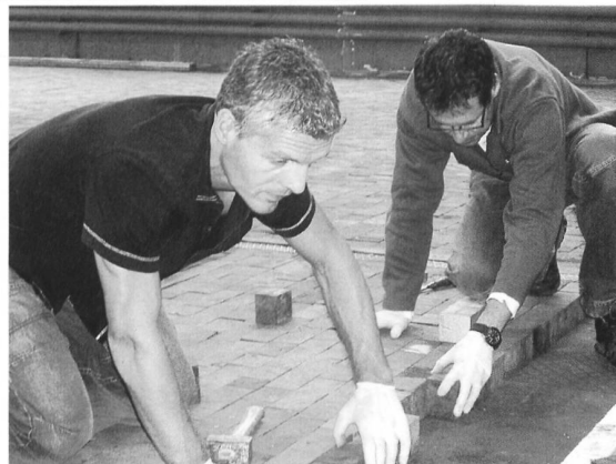
Zwei Rotarier bauen den Klötzli-boden neu. Die Handschuhe sind nötig, weil die Klötzli teilweise arg verölt und schmutzig sind, nicht weil die Rotarier zu „nobel“ sind für's Arbeiten!