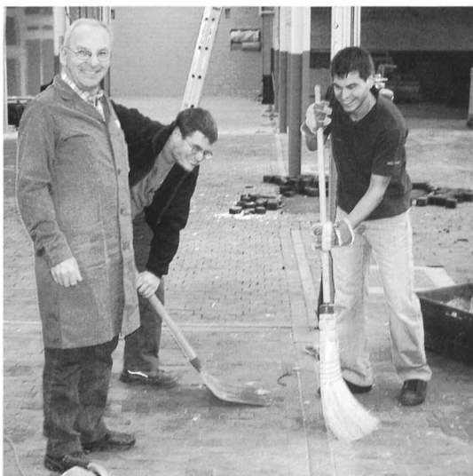
Drei OCS-Helfer an der Arbeit (was gibt's denn da zu lachen)