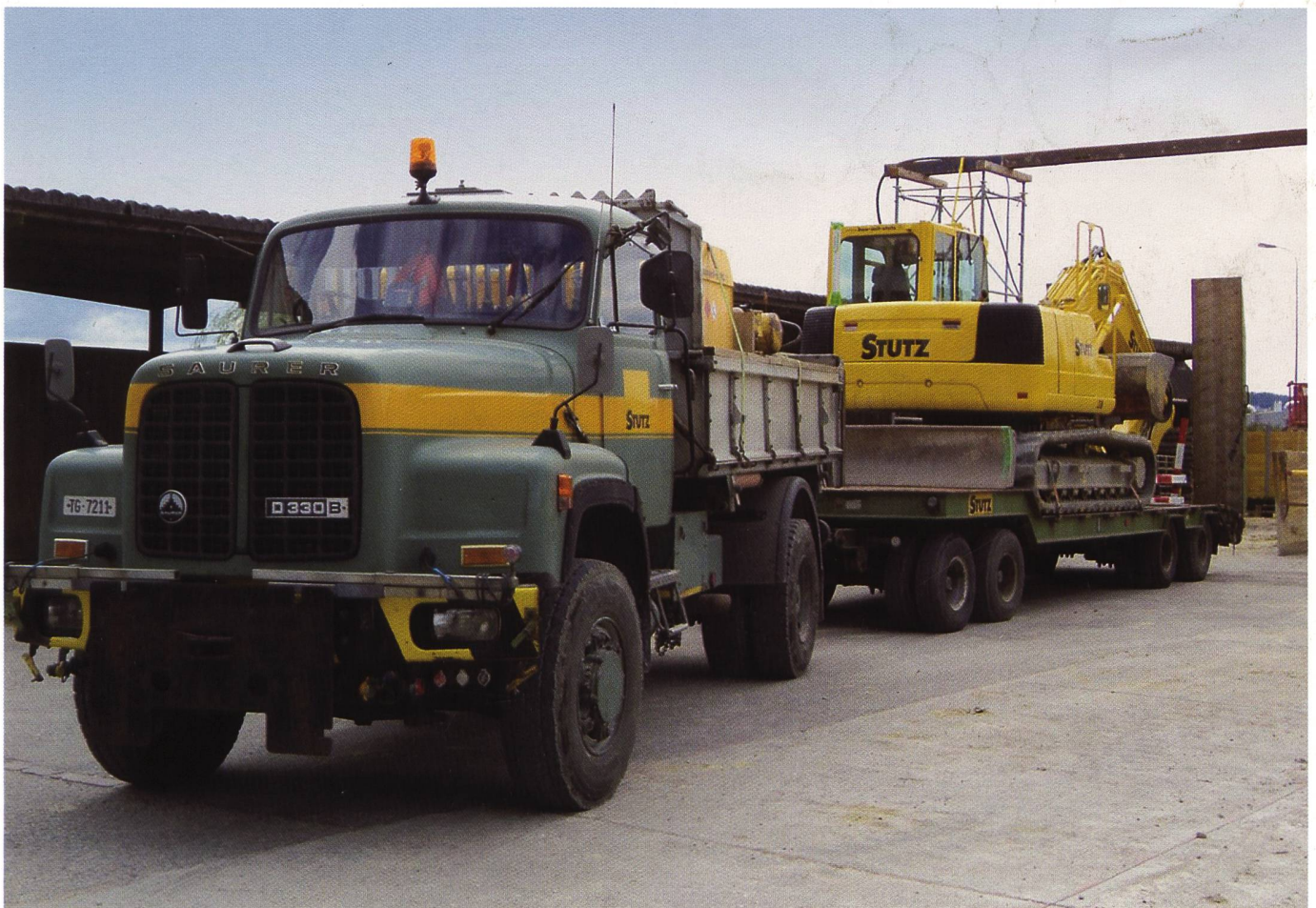
Urs Geigers D33 B 4x4 auf letzter Fahrt