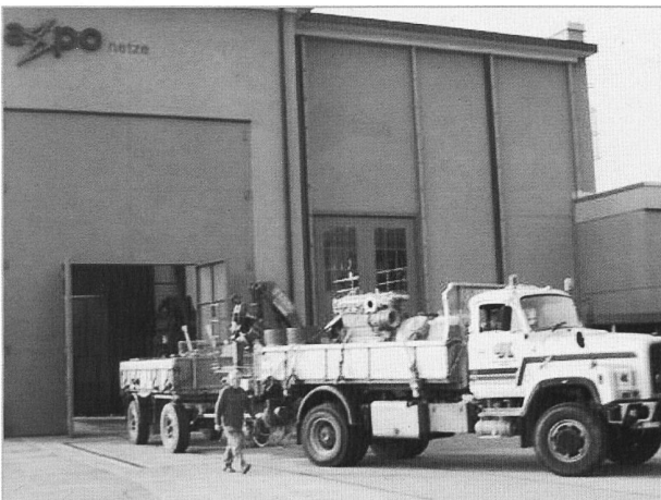
Nach dem guten und reichlichen Mittagessen im Restaurant Kapellhof nehmen wir den Rückweg unter die Räder.