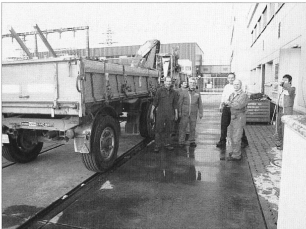
Den Rest der Anlage wird auf Anhänger und Lastwagen verteilt, sodass es letztlich eine komplette Fuhre gibt. Es wird alles richtig gebunden, (sogar gezöpfelt) sodass die Anlage sicher und unbeschädigt in Arbon ankommen soll.