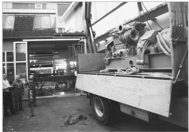
Dann kommt auch die Notstromeinheit an den Hacken.