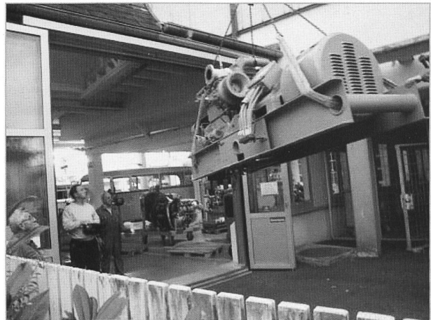
Sie wird sicher in den Eingang des Museums gesetzt und dann mit zwei Palettenrollies in das Museum hineingebracht.