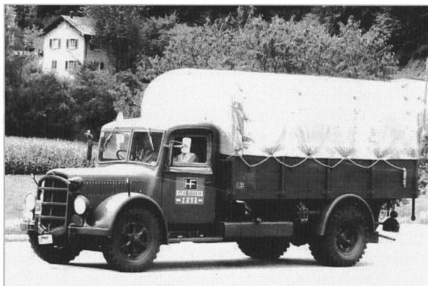
Bild aus der Schweizer Illustrierten von 1943 - nein, Bild von heute