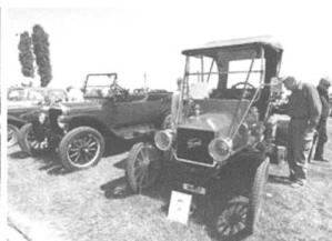
Arbon Classics: im Zeichen der Nostalgie.