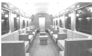
Swiss Classic Train: ein Blick ins Innere.