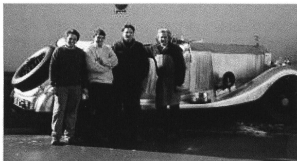
Vater und die Söhne Vonier, alle im Museum tätig

Dauer: 3 Stunden (Abfahrt/Ankunft Rolls-Royce Museum), Preis: 110 € pro Stunde zzgl. 2,5 € pro Km.