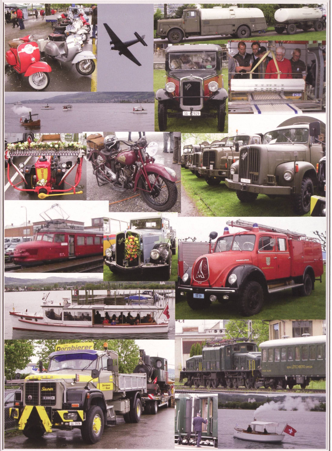
Arbon Classics 2012, ein toller Anlass, ist bereits Geschichte. Wir freuen uns jetzt schon auf Arbon Classics 2014