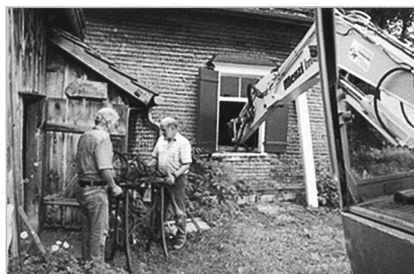
Millimeterarbeit und Handarbeit waren gefragt

Fein säuberlich galt es, die Maschine Teil um Teil zu demontieren. Die einzelnen Teile wurden beschriftet, teils fotografiert, damit später der originalgetreue Zusammenbau einfacher erfolgen kann. Nicht so einfach gestaltete sich der Transport aus dem Stickereiraum ins Freie. Die kleineren Elemente konnten zu Zweit oder mit mehr Personen getragen werden. Für die grösseren brauchte es den geübten Baggerfahrer, der für den Abbruch des Hauses am folgenden Tage ebenfalls schon vor Ort war. Mit sicherer Hand und in Millimeterarbeit führte er die Baggerschaukel durch die Fensteröffnung und schwebend kamen die grossen Längsteile so ins Freie.