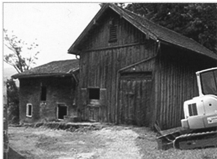
In diesem Haus ruhte der Oldtimer