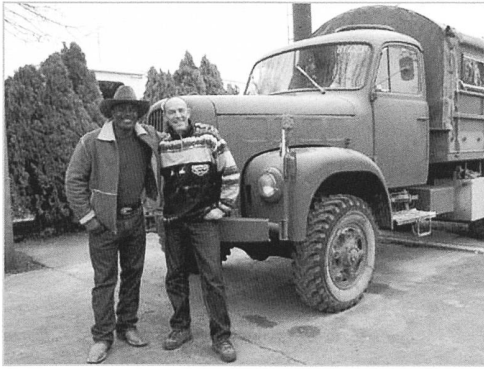
Schwarz und weiss werden Freunde

unserem Stecker Problem. Kurzum geht er zu seinem Pickup und kehrt mit einem Adapter in der Hand zurück.