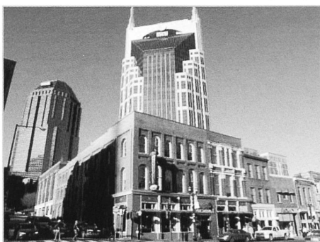
Nashville – alt und neu vermischt sich

„Music City USA“ der Spitzname sollte die Stadt beschreiben. Nashville gilt heute als die Stadt der Countrymusik. Wer nun aber glaubt, überall auf alte Cowboypinten, schnuckelig romantische Musikgigs in Hinterhöfen und ähnliches zu treffen, der verkennt Amerika. Längst ist das Geschäft mit der Countrymusik – seit Jahrzehnten von langer Hand geplant – eine Goldgrube für das Big Business. Was für Dallas die Banken und Atlanta die multinationalen Konzerne sind, das ist für Nashville die Countrymusik bzw. die Kultur, die um sie gesponnen wird. Gestresste Radiomanager, rotierende Filmagenturen, riesige Glaspaläste, Tausende von Musikern, die sich in zig Musikclubs die Klinke in die Hand geben und die grösste Showhalle der USA, die Grand Ole Opry, bestimmen heute das Bild der Stadt. Schon nachmittags um 15.00 Uhr sitzen wir in einer Kneipe bei einem Bier und hören Live-Countrymusik. Eigentlich genau so, wie wir uns das vorgestellt