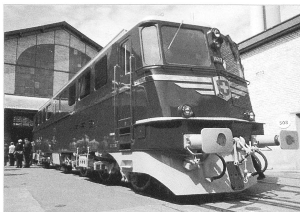
Die legendäre Schweizer Lok; frischrestaurierte Ae6/6 (SLM, BrownBoveri & Cie, Maschinenfabrik Oerlikon) aus dem Jahre 1955