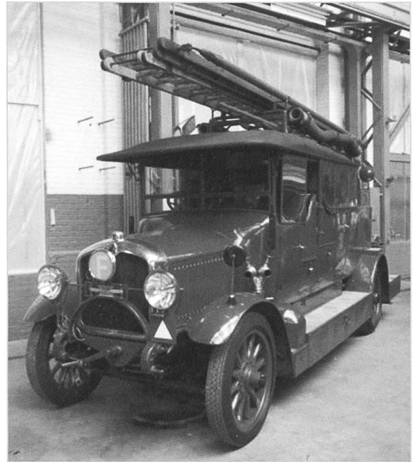
Selten zu sehen; die ehemalige Winterthurer Feuerwehrspritze Saurer 2AC von 1923