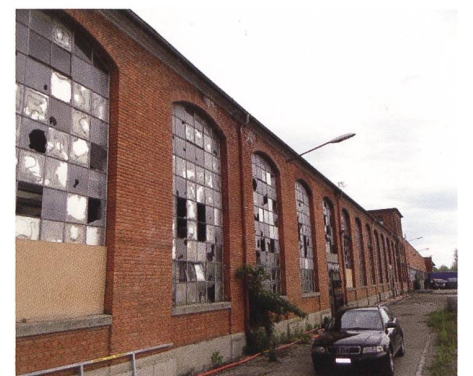
Abbildung 3: Die Renovation ist dringend: Dach und Fenster sind sehr kaputt

Bitte beiliegenden Einzahlungsschein verwenden.