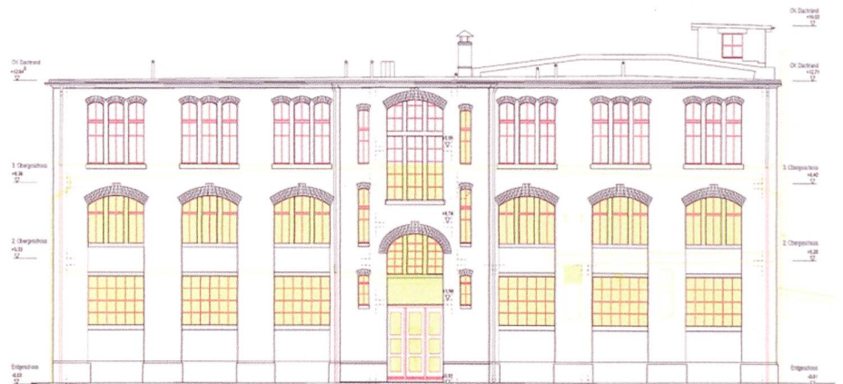
Abbildung 1: Die heute versteckte, neu wieder sichtbare Fassade gegen den See

Presswerk (früher auch «Kraftwerk»): Areal auf der Nordostseite von WerkZwei, bestehend aus einem Grundstück sowie einer alten Halle mit angebauter Lastwagen-Reparaturfirma. Dieser neuere Teil wird abgebrochen, sodass das ehemalige eigenständige Presswerk wie-