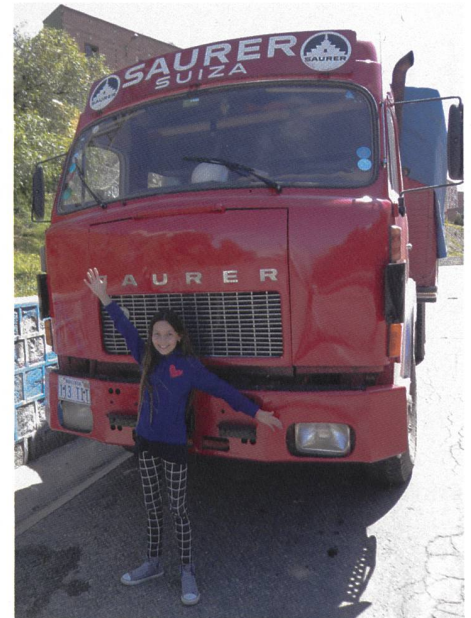
Eine Mexikanerin entdeckt in Bolivien einen Arboner !