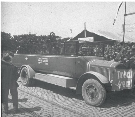
Unbekannter Anlass im Raum Zürich in den 1930er Jahren