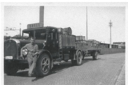
Trägt vermutlich die Betriebsnummer 102. Ort unbekannt, Vermutung A.Heer: Freiverlad St.Gallen