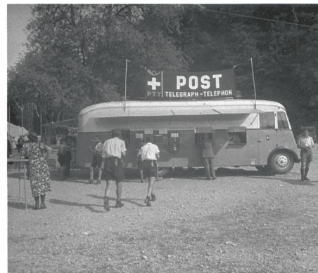
Pfadfinder Bundeslager 1938 / Post-Büro