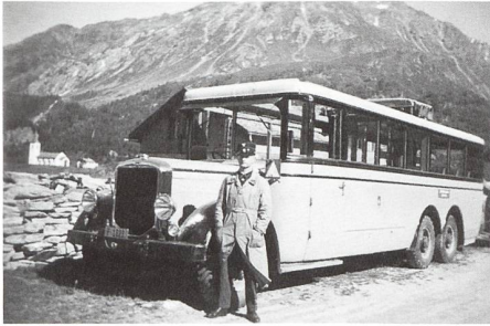
Maloja / Sommer 1935