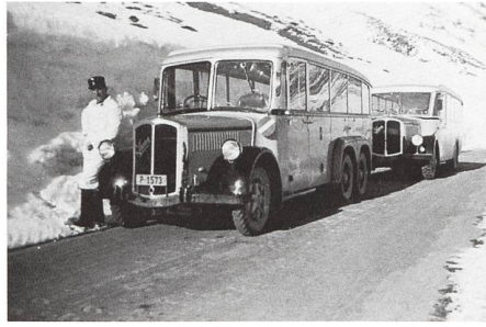
Julier / April 1940