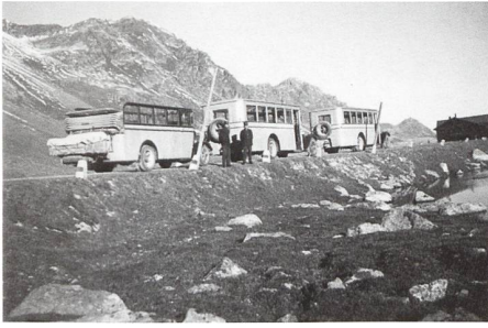
Flüela / September 1936