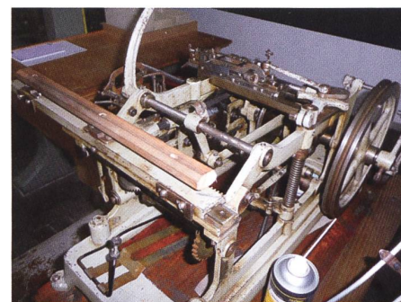
Die im Bericht ebenfalls erwähnte Fädelmaschine, Konstruktion und Patent Saurer