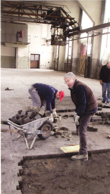
Der Klötzliboden muss repariert werden