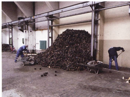
Ein grosser Haufen Reserveklötzli wird umgeschichtet und verschoben