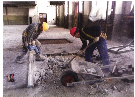
Grossartige Unterstützung durch die Profis, ein toller Service von hrs