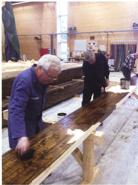
Das grosse Loch der ehemaligen Presse muss mit neuen Planken abgedeckt werden