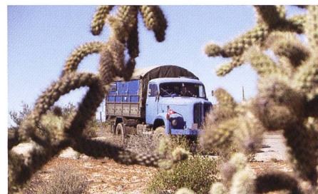
In der Cataviña-Wüste

Der einzige Ort in der Wüste ist Cataviña. Er besitzt die einzige Tankstelle im Umkreis von 160 km. Es gibt ein Hotel, einen Mechaniker, eine Gaststätte und eine geschlossene Bahnstation. Kurz nach der Ortschaft lässt uns ein Bauer auf seinem Grundstück übernachten. Schon beim Aufstehen lacht uns die Sonne entgegen. Bis heute hatten wir noch keinen Tropfen Regen und Temperaturen um die 25C°. Ja super, genau so stellt man sich das Entfliehen vor dem Winter in der Schweiz vor. Wir brauchen den ganzen Tag bis wir die Kaktuswüste hinter uns gelassen haben und vor uns die Stadt Guerrero Negro auftaucht.