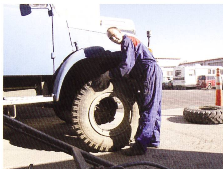
«Hüsli» kriegt neue Schuhe (Rico)

Die vor uns liegende Strecke fahren wir nun schon zum x-ten Mal, und so sind auch die Pausen schon fast vorhergesagt. Wir schaffen es heute sogar weiter