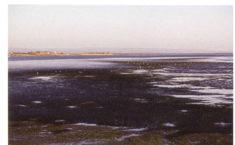
Bucht von San Quintin

Wir verlassen die Stadt Richtung Süden und erblicken nach kurzer Fahrt ein Schild: Camping. Über eine Staubsstrasse erreichen wir ein Hotel mit Campingplatz. Der Besitzer ist erstaunt über unser grosses Gefährt und wittert ein gutes Geschäft. 240 Pesos will er zum Übernachten am Strand, wobei der Strand aus einer Baustelle mit Nichts besteht. Trotzdem entschliessen wir uns hierzubleiben, aber als seine Frau die Rechnung schreibt, will sie plötzlich 480