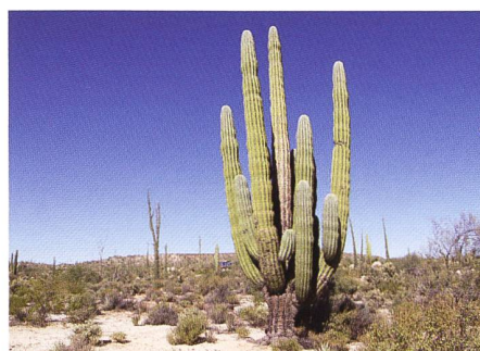
Cardon-Kaktus, grösster Kaktus der Welt

Bis El Rosario verläuft die Strasse Mexico No 1 der Küste entlang. Dann biegt sie ins Binnenland ab und führt mitten durch die Halbinsel. Vor uns liegen über 350 km. Die Carretera führt uns durch die Cataviña-Wüste, eine urwüchsige Landschaft aus Kakteen, vor allem Yucca, Cirio-Pflanzen und die bis zu 15 Meter hohen Weberdisteln und bizarren