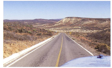
Unterwegs auf der Carretera Mexico No 1

Tijuana glänzt nicht mit dem besten Ruf. Als eine der grössten Grenzstädte zu den USA ist sie ein Magnet-Punkt für Verbrecher, Halunken und Diebe. Es ist ratsam sich nicht länger als nötig, wenn überhaupt, in und um Tijuana aufzuhalten. Da wir die Warnungen der Reisebücher und anderen Reisenden ernst nehmen, sind wir gezwungen, trotz der beginnenden Dunkelheit weiterzufahren. Wir erreichen die Küstenstrasse Mexico No 1