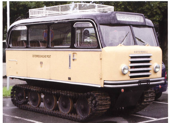
Ein «Schmankerl» im Buch ist der Hacker-Lohner Motormuli, so eine Art Pistenfahrzeug für die Strasse, gebaut für Passagier- und Gepäcktransport in den Alpen.

Für unsere Leser von besonderem Interesse sind natürlich die von Saurer Österreich in den Jahren 1946 - 1971 gebauten Fahrzeuge, sowie der Übergang von Saurer zu Steyr, der ebenfalls ausführlich beschrieben ist. Auf fast hundert Seiten ist hier ein ganz besonderes Kapitel «unserer» Geschichte beschrieben.