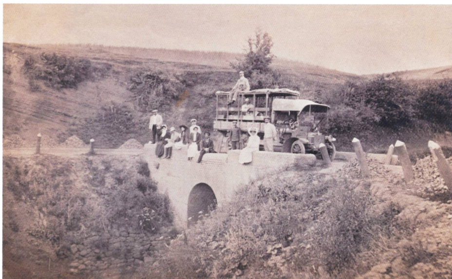
Saurer 3TC Jahrgang 1911, irgendwo in Russland