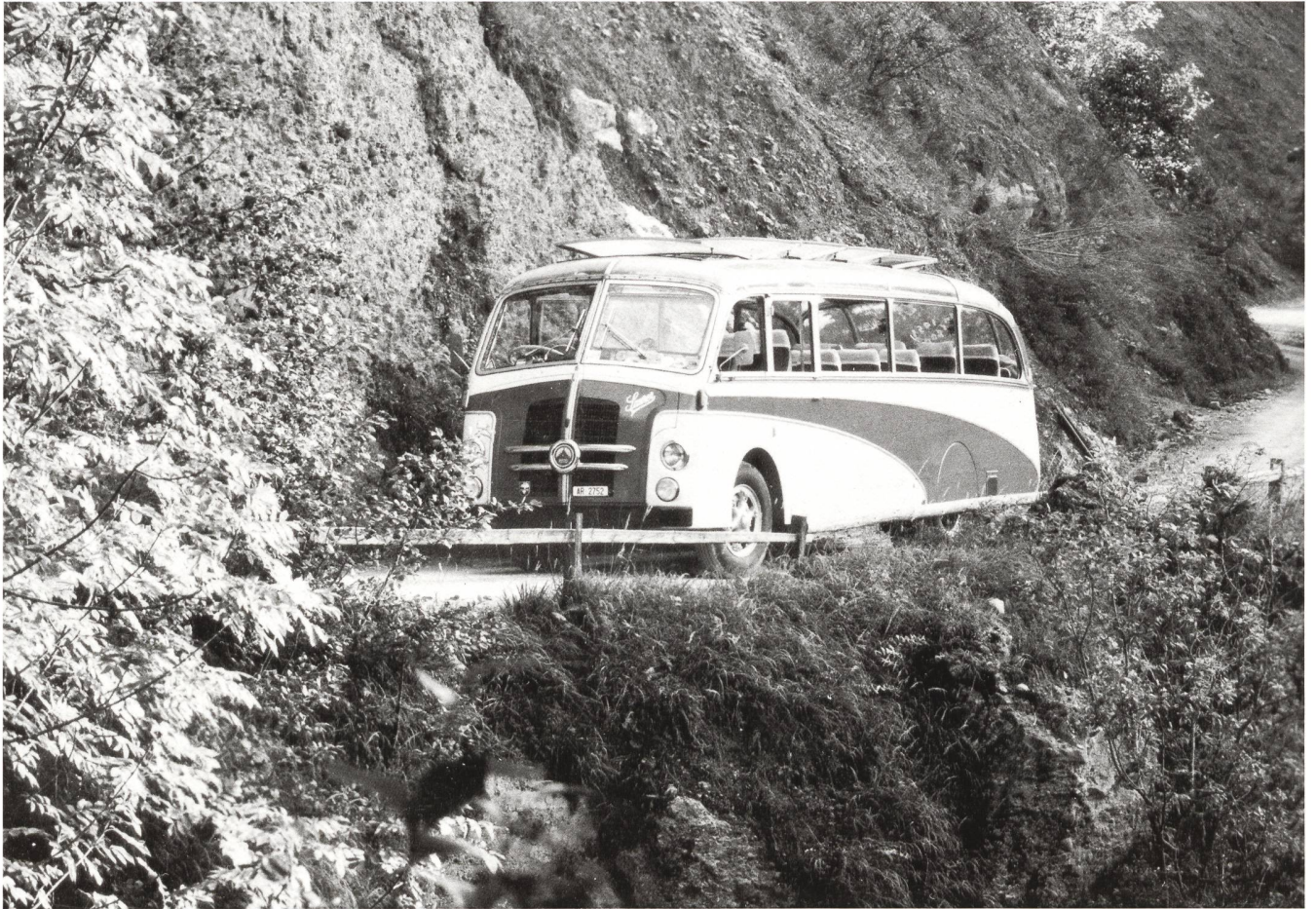
Ottocar Saurer 1951

Otto Brander Chapfenbühlweg 4 CH-9100 Herisau tel. 071 / 51 30 75