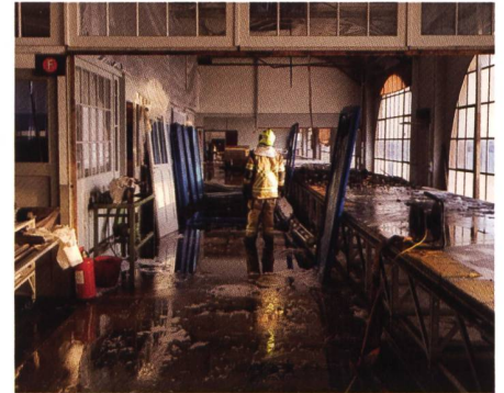
Ein trauriger Tag: Im WerkZwei brannte das Dach der Webmaschinenhalle. Die Firma TdS erwischte es ganz gewaltig: Blick in die Druckerei am Tag nach dem Brand.