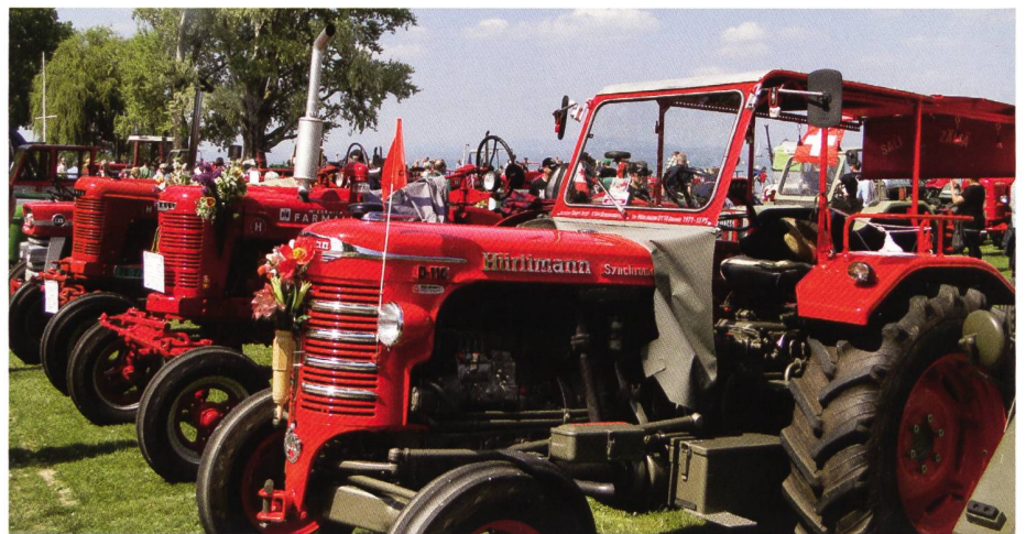
Die Hürlimannen – einst der Stolz jedes Bauern – und des Cirkus Knie!

Dann die grossartige riesige Ausstellung von wunderschönen New- und Oldtimer-PWs. Soweit das Auge reicht, nur DKWs, MGs, Opel Kadett, schöne Mercedes, Mustangs, Vipers, ich kann nicht einmal einen Bruchteil aufzählen. Beim Fliegerdenkmal an der besten