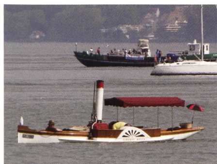
Klassisches Dampfboot.

Auch auf dem See, da war was los. Hohentwiel, Ledischiffe, Passagierschiffe, historische Segler, herzige Dampfboote, man kommt nicht nach mit Schauen. Maximal dann die Kunstflug-Darbietungen, von absoluten Profis an den Him-