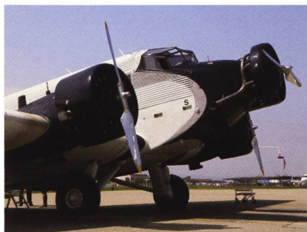
Sie darf nicht fehlen, die Tante Ju.

mel gezeichnet, mit Staffelvorbeflügen, mit der Tante Ju, die von oben zuschaut, und dann wartete man gespannt auf den Hunter. Unglaublich, eigentlich eine uralte Kiste. Aber welche Show! Zuerst mit minimalem Abstand ein Durchflug, knapp vor den Zuschauern. Hammer! Dann Kunstflugfiguren. Toll. Gratuliere, Chapeau!