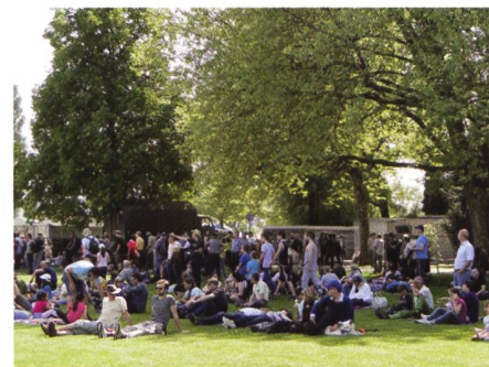
Friedliche Zuschauermassen, wartend auf die Patrouille Suisse.

dafür in geballter Ladung, keine Lastwagen, aber rund 800 PWs und wieder tausende von gutgelaunten Zuschauern und viele, viele Attraktionen. Höhepunkt am Sonntag sicher die unglaubliche Akrobatik des grössten Militärhelikopters der Schweizer Armee, dem Super Puma. Man war platt, was dieses Riesenvehikel (und seine Piloten!) zeigten.