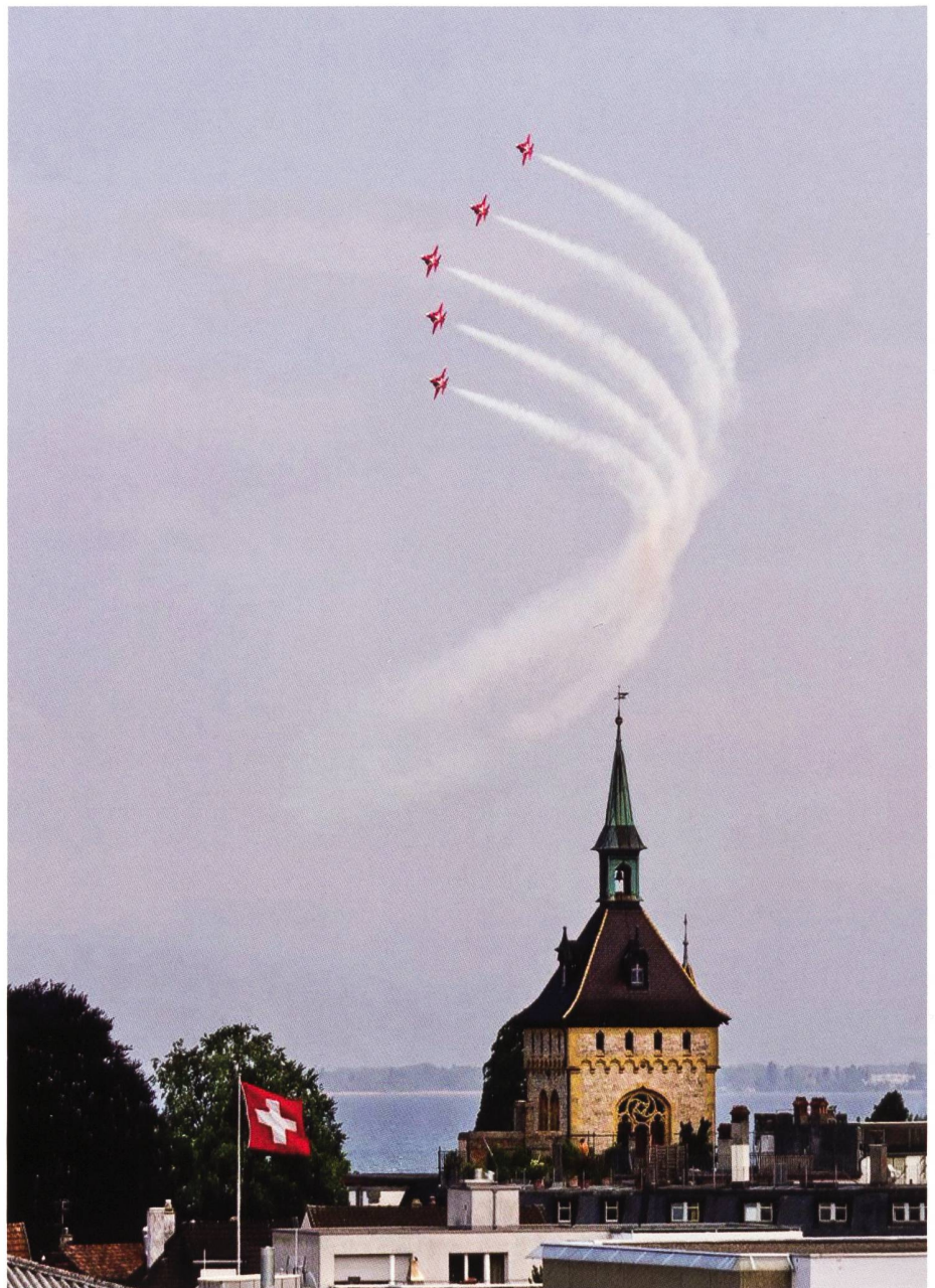
Die ganze Staffel – grandios.