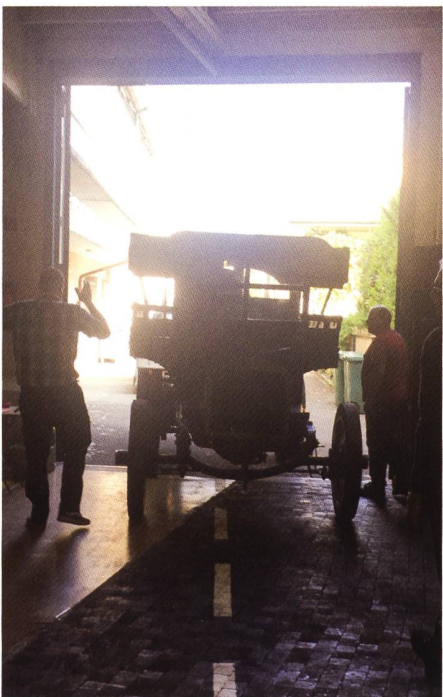
Der Caminhao im ersten Sonnenlicht.

Am Samstag Morgen liessen es sich unsere Garagenprofis nicht nehmen, den Caminhao anzuwerfen und in die Parkanlage vor dem Museum zu stellen. So viele interessierte Zuschauer hat der Caminhao wohl schon lange nicht mehr gesehen. Auch am Sonntag durfte der Caminhao sich wieder von seiner schönsten Seite präsentieren.