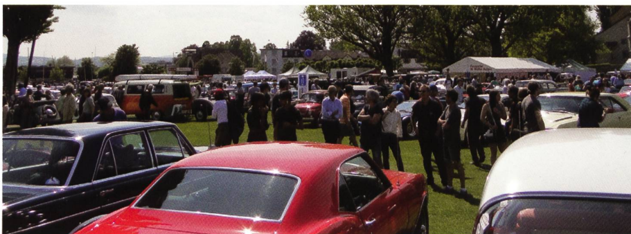
Leute – viele Leute – aber kein Gedränge und die über tausend Classic-Cars, ein wahres Vergnügen