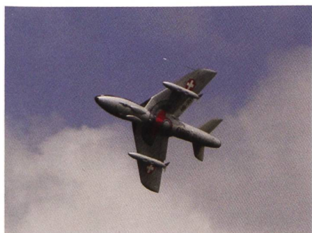
Der Hunter im Vorbeiflug.

mel gezeichnet, mit Staffelvorbeflügen, mit der Tante Ju, die von oben zuschaut, und dann wartete man gespannt auf den Hunter. Unglaublich, eigentlich eine uralte Kiste. Aber welche Show! Zuerst mit minimalem Abstand ein Durchflug, knapp vor den Zuschauern. Hammer! Dann Kunstflugfiguren. Toll. Gratuliere, Chapeau!