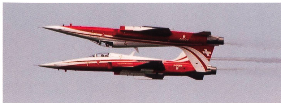
Rücken an Rücken, zwei absolute Kunstflugpiloten.

Am Sonntag dann etwas geruhsamer, nur noch wenige Landmaschinen, aber