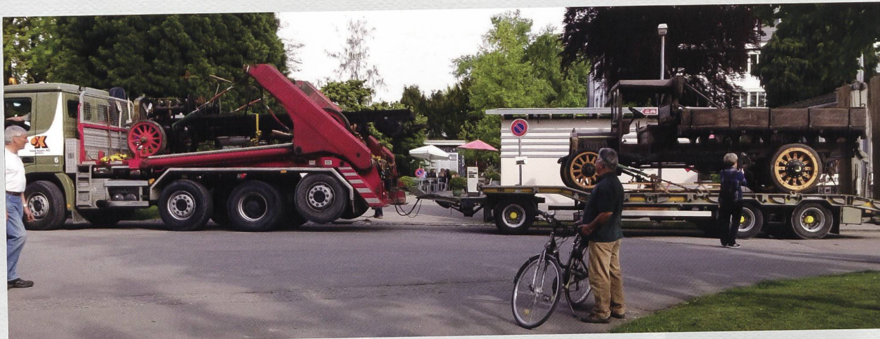
Nach Redaktionsschluss am 25./26. Mai 2019 fand die 6. Swiss Classics World in den Messehallen von Luzern mit der grossen Saurer-/Berna-Sonderausstellung statt. Ein Foto von der Verladeaktion haben wir grad noch rechtzeitig erhalten. Dank dem eingespielten Logistikteam Kugler und Kugler sowie einer engagierten Verladetruppe unseres Ziischtig-Clubs konnten wir die beiden Schätze unbeschädigt aus dem Museum herausfädeln. Zum Zeitpunkt des Erscheinens dieser Gazette sind die beiden Fahrzeuge schon wieder wohlbehalten ins Museum zurückgekehrt. Wir werden in der nächsten Nummer noch ausführlich über die Ausstellung berichten.