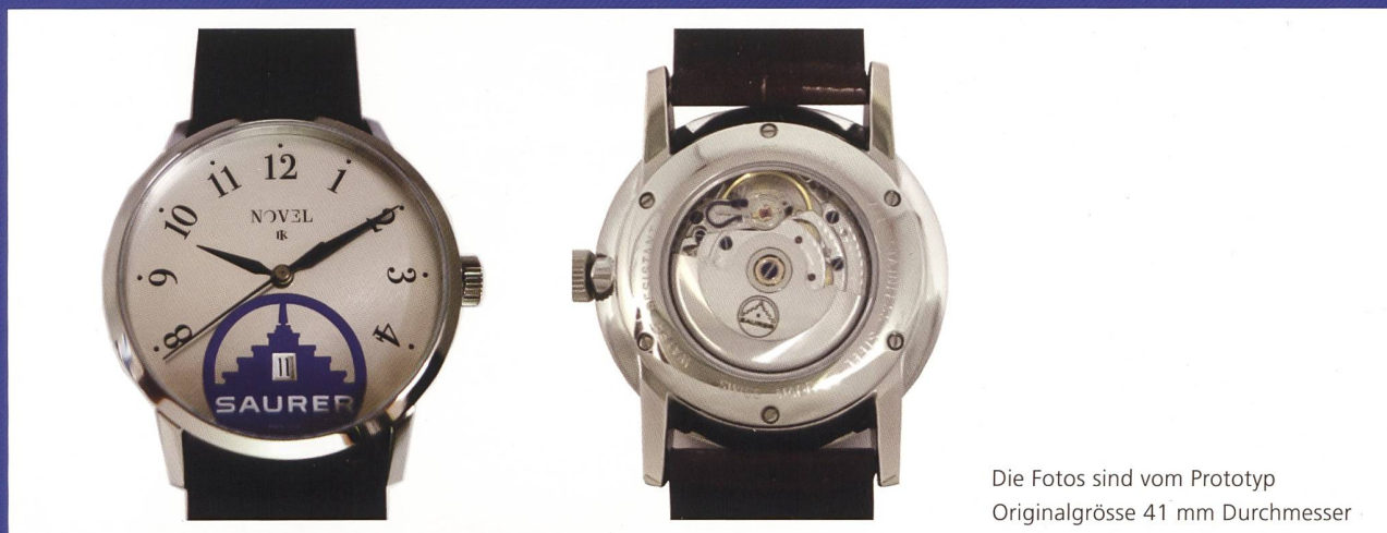
Die Fotos sind vom Prototyp Originalgrösse 41 mm Durchmesser

100% Schweizer Produkt; Entwurf, Finissage, Design und Bau/Montage durch NOVEL UHREN KLG aus Schaffhausen. Ursprünglicher Entwurf durch Miki Eleta, Uhrenkonstrukteur der «Zeitmaschinen».