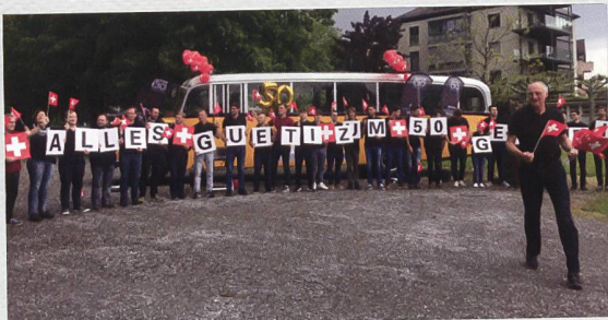
50 Jahre EDAG; wer ist EDAG? Schon mal was von Rücker gehört? Das ist die renommierte Lastwagen-Entwicklungsfirma aus und in Arbon, welche für verschiedene Hersteller Nutzfahrzeuge entwirft. Die Mutterfirma EDAG feierte ihr 50. Jubiläum, unser Postauto wurde als historische Kulisse gewünscht.