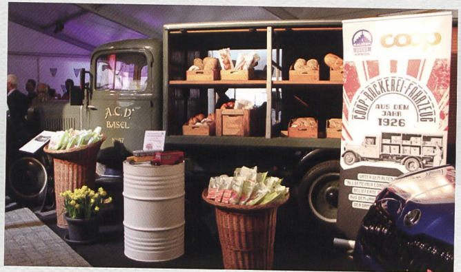
Tolle «Messe am See» in Arbon. Wir durften als Gäste unser Coop-Brotwägeli ausstellen und tausende von fein duftenden, frisch gebackenen Osterhäslis samt Zopf-Gutscheinen verteilen. Danke den Messeorganistoren für die perfekt organisierte Messe, danke Coop für das Spendieren der vielen Osterhäslis und Gutscheine, danke aber auch den vielen OCS-Helferinnen und Helfern, die so charmant die Häslis verteilten