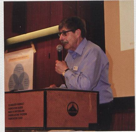
Grossandrang an der HV 2019 des OCS