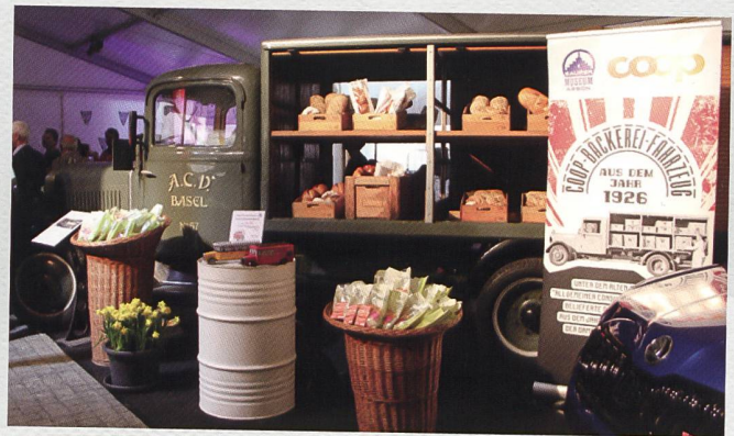
Tolle «Messe am See» in Arbon. Wir durften als Gäste unser Coop-Brotwägeli ausstellen und tausende von fein duftenden, frisch gebackenen Osterhäslis samt Zopf-Gutscheinen verteilen. Danke den Messeorganistoren für die perfekt organisierte Messe, danke Coop für das Spendieren der vielen Osterhäslis und Gutscheine, danke aber auch den vielen OCS-Helferinnen und Helfern, die so charmant die Häslis verteilten