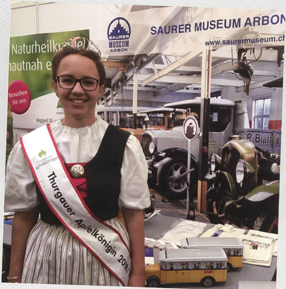
Tourismus-Pop-up-Messe am 2. März 2019 in Weinfelden: Die Thurgauer Apfelkönigin beehrt uns mit einem Besuch