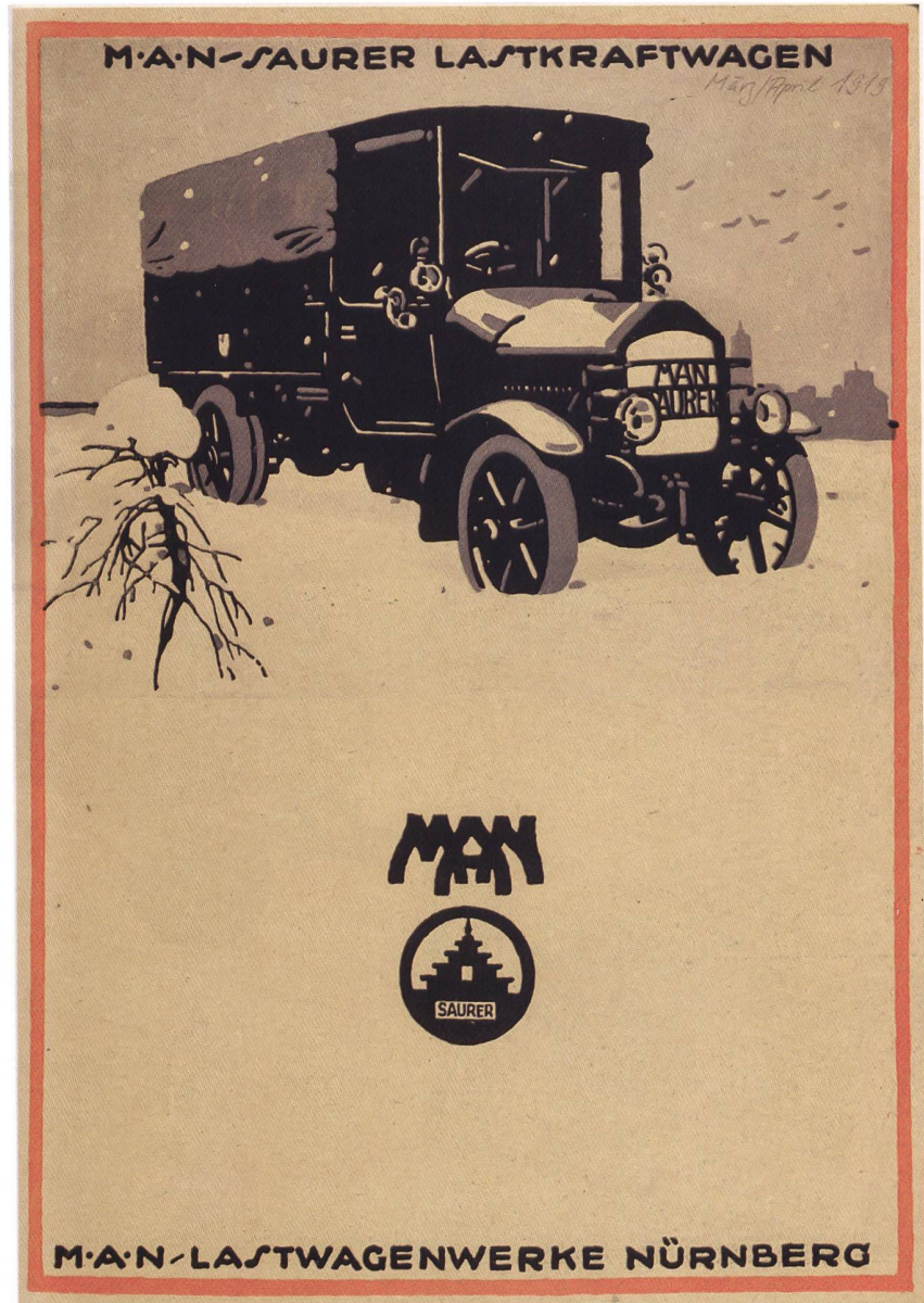
MAN-Saurer Werbeplakat vom Januar/Februar 1919.

1931 kam es dann im gegenseitigen Einvernehmen zu einer freundschaftlichen Auflösung der gegenseitigen Lizenzverträge.