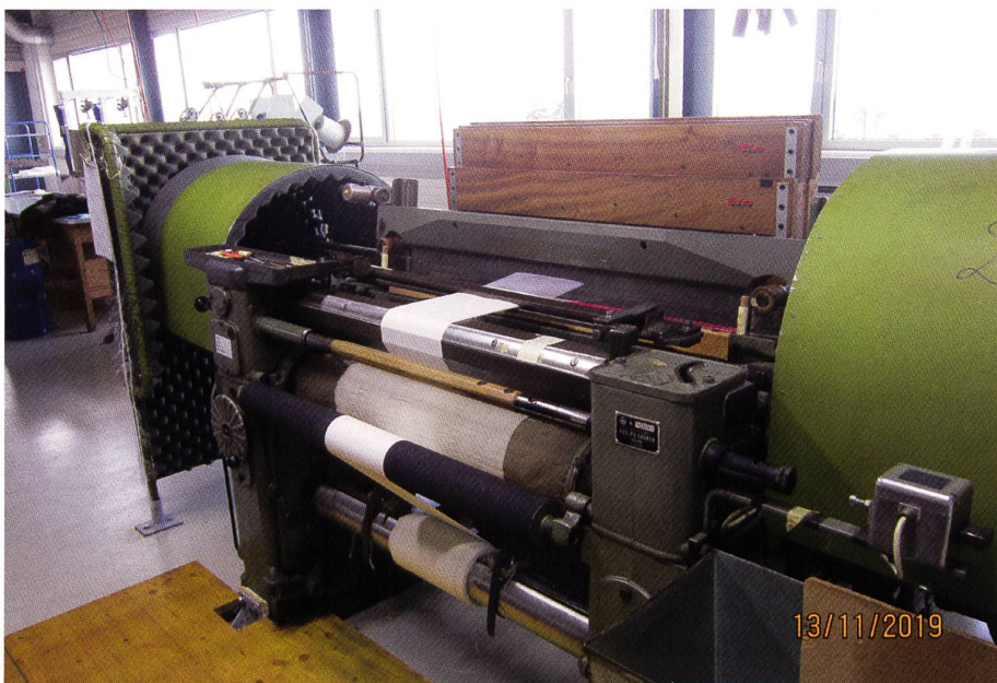
Die über sechzig Jahre alte Webmaschine, immer noch im produktiven Einsatz!

Dies ist ein weiterer Pluspunkt der «Schiffchen»-Technologie. Wir können gleichzeitig S- und Z-Zwirne einschliessen. Dadurch liegen immer zwei Zwirne mit entgegengesetzter Drehrichtung nebeneinander und somit kann der Drall neutralisiert werden. Unsere Antriebsriemen und Transportbändern erhalten dadurch einen stabilen und neutralen Lauf.